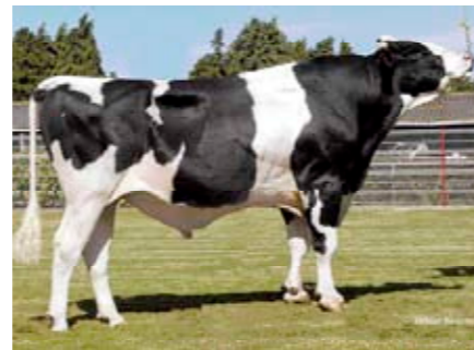
Van boven naar beneden: Guimauve, één van de drie Southwindzussen uit Lolli Ramine (v. Aaron), stiermoeder en 90 pnt. Fokstier Rouki, uit de Grenadetak