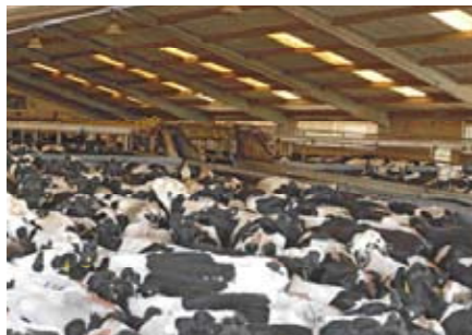
Koeien, waaronder 225 excellente dieren, samengedreven voor de melkput