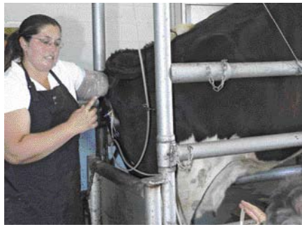
Eigen et-team wint jaarlijks 5000 embryo's uit 1100 et-sessies