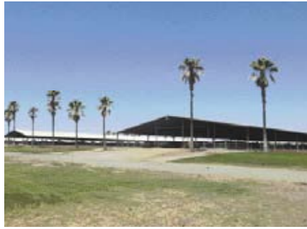
Grote stallen bieden plaats aan 12.000 dieren