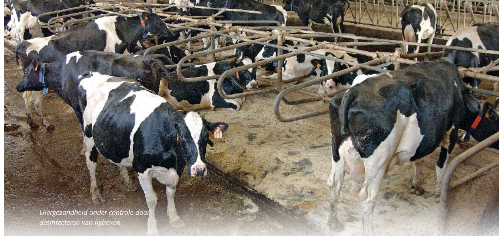
Uiergezondheid onder controle door desinfecteren van ligboxen

mais en 53 hectare grasland. 'Inkuilen neemt maximaal een dag in beslag. Voor een goede fermentatie moet de kuil gewoon zo snel mogelijk dicht.' De vier melkveehouders huren zelf een hakselaar om het gras en de mais te oogsten. 'Om de kosten te beperken moet het inkuilen snel en efficiënt gebeuren.'