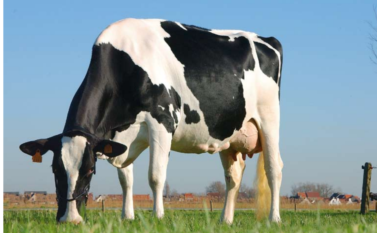
Walvis (v. Starfire), 89 punten Productie: 2.10 305 10.543 4,48 3,52