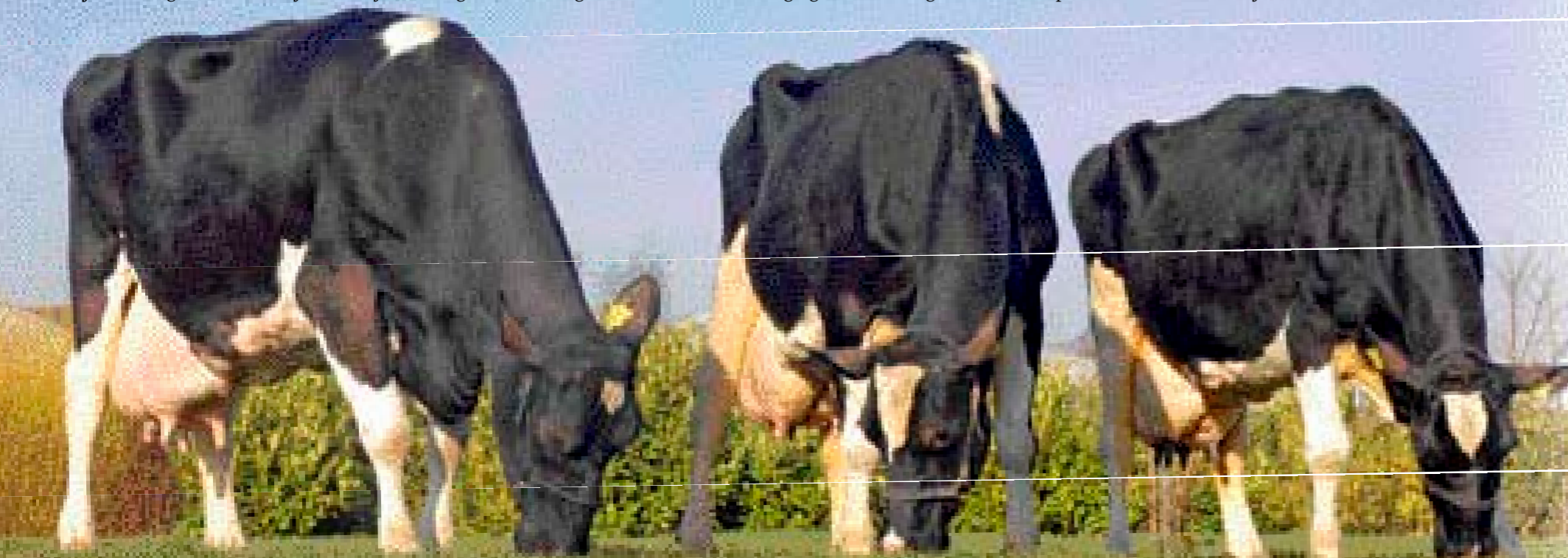
De drie tientonnars met v.l.n.r. Marie 295 (v. Searle), Geesje 82 (v. Opvolger) en Geesje 80 (v. Elbert)