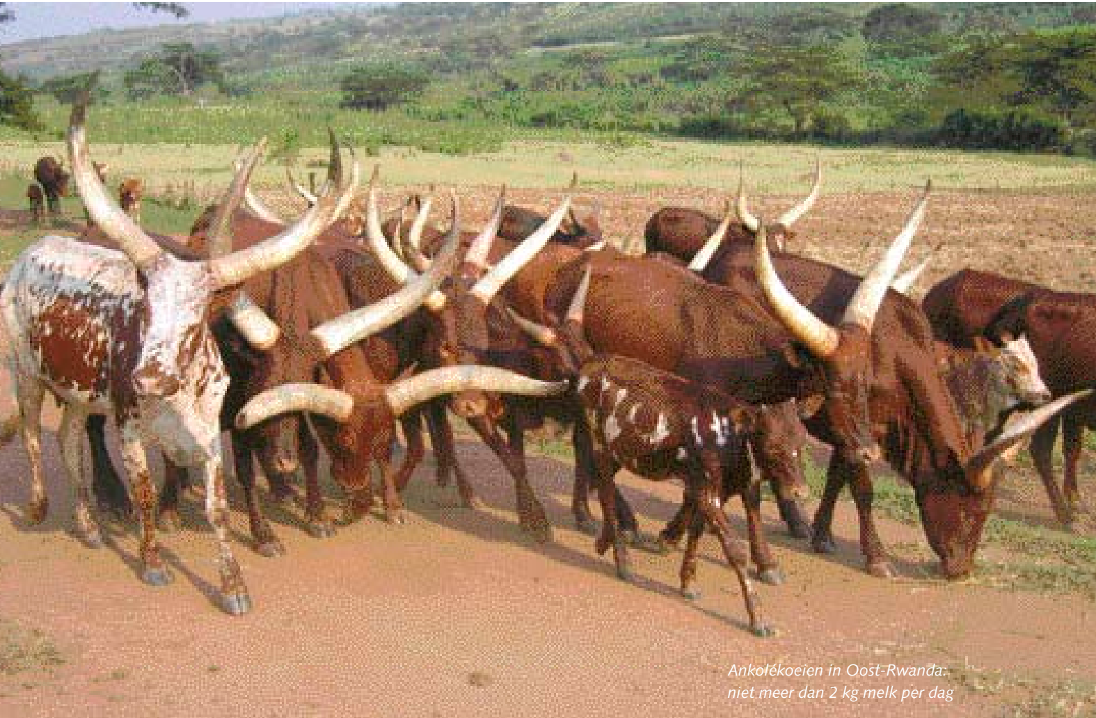
Ankolékoelien in Oost-Rwanda: niet meer dan 2 kg melk per dag

Holstein- en jerseykruisingen tillen productie naar hoger niveau