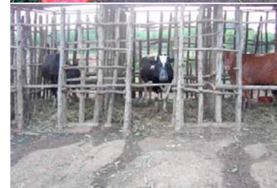
Boven: iedere familie een koe Midden: meer melk is nodig Onder: koeienstalling in Rwanda

hankelijk te maken van het buitenland. De in 2005 gedeeltelijk geprivatiseerde ki-dienst heeft in de afgelopen jaren 25.000 dieren geïnsemineerd. Helaas laat het drachtigheidspercentage met dertig tot veertig procent nog te wensen over. Dat komt door een slecht ontwikkelde infrastructuur. Verder speelt de nog beperkte ervaring van de inseminatoren een rol.