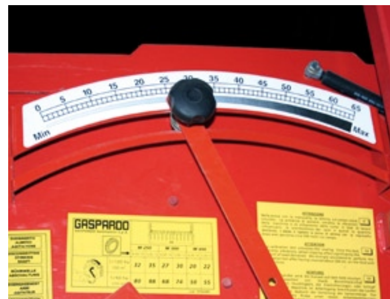
▲ Met behulp van de zaaitablet kun je de fijnafstelling instellen.

De machine heeft verschillende opties, zoals een bordes om de bak te vullen. Ook het zaaien van twee gewassen is mogelijk. Hierbij wordt een extra bak in de zaaimachine geplaatst. De uitlopen hangen net voor de veertandeg die eveneens een optie is. Op de machine is ook een elektronische rijpad-schakeling leverbaar.