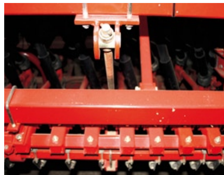
▲ Met de spindel links voorop de machine stel je de kouterdruk in.