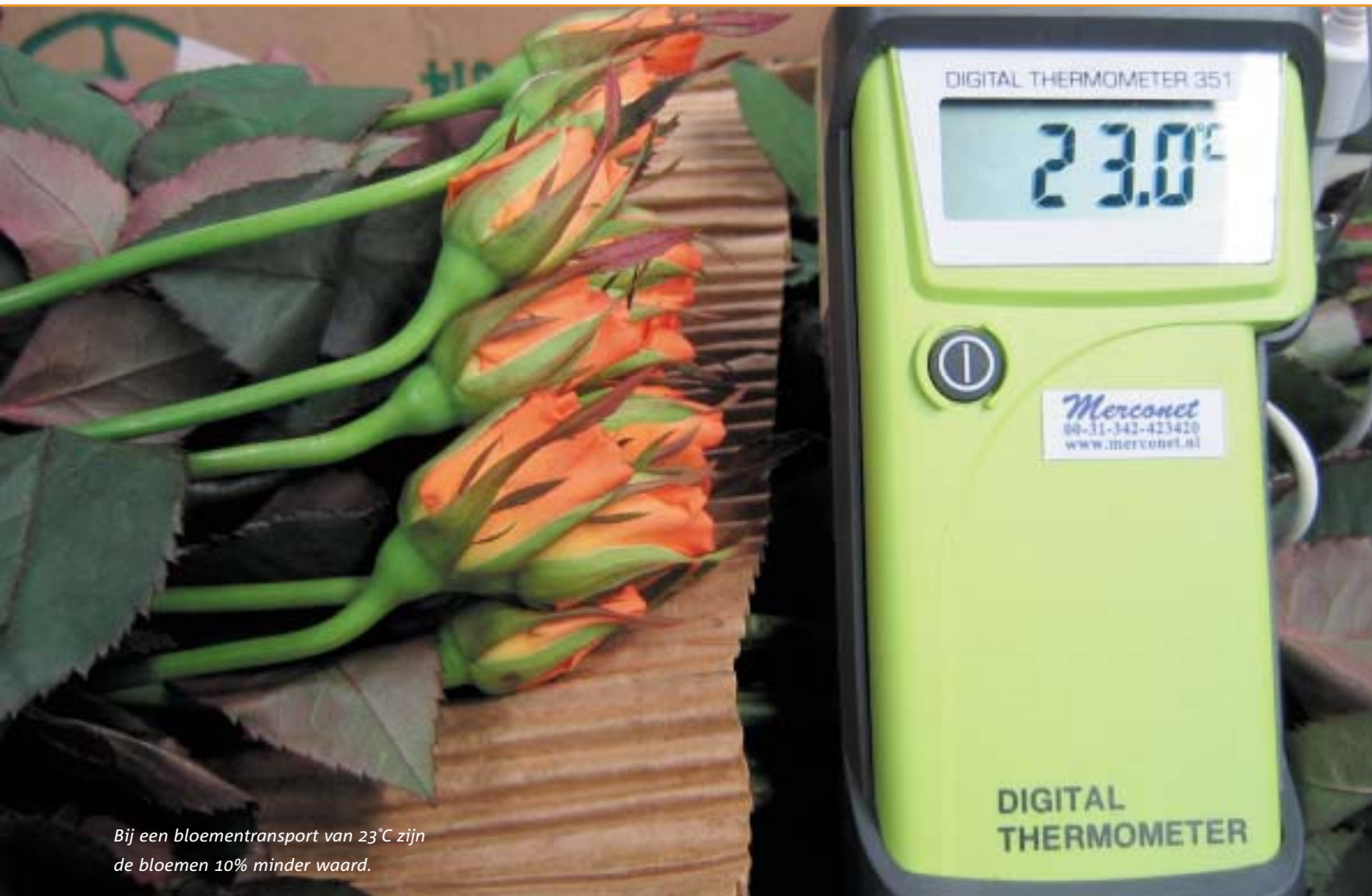
Bij een bloementransport van 23°C zijn de bloemen 10% minder waard.

Belastingvoordelen, goede klimatologische en geografische omstandigheden, gunstige kredietfaciliteiten, goedkope arbeid en lage grondprijzen. De Afrikaanse bloementeel, met name die in Oeganda en Ethiopië, biedt goede kansen voor Nederlandse investeerders. Er zijn echter ook kanttekeningen te plaatsen.