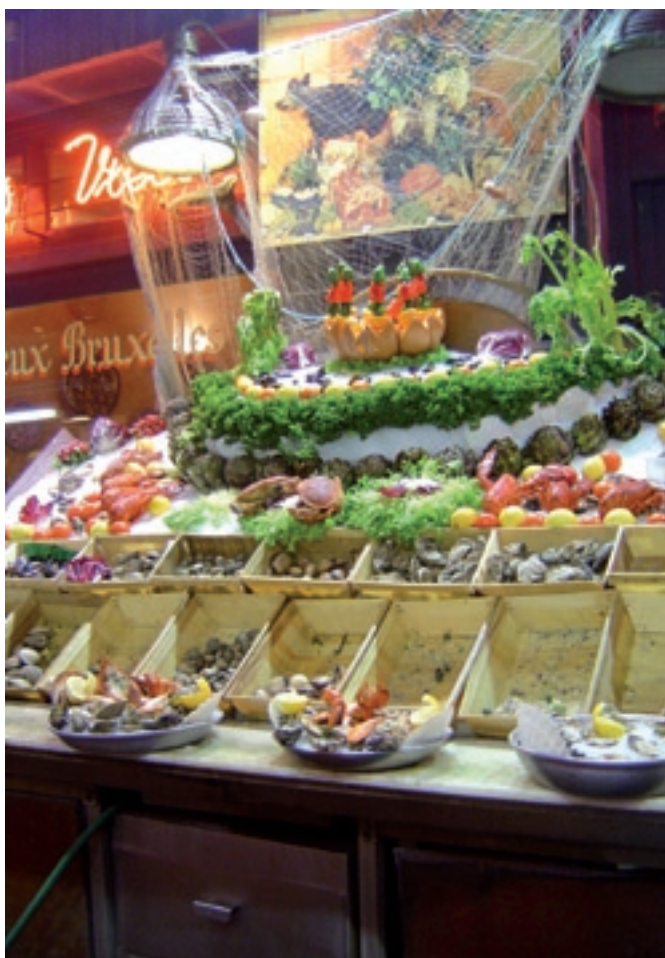
Belgen staan bekend om hun bourgondische levensstijl.

De Belgische biologische markt lijkt voor Nederland een zeer interessante markt om mee samen te werken en om in te investeren. De vraag, vooral in Vlaanderen, naar biologische producten stijgt sneller dan het aanbod. Momenteel wordt een groot deel van dit tekort geïmporteerd en men verwacht dat dit percentage zal blijven groeien. Aangezien ook in België consumenten zich steeds meer zorgen maken over hun ecologische voetafdruk, lijkt het voor de hand te liggen om deze producten 'dichter bij huis' in te kopen. Ook de verhoogde aandacht voor het inkopen van lokale en seizoensgebonden producten en de gemeenschappelijke taal maakt de Belgische markt de moeite waard voor de Nederlandse biologische sector.