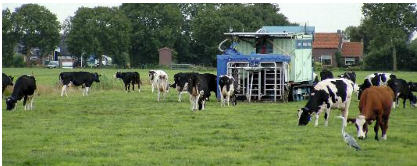
De mobiele melkrobot in de praktijk. De robot is een oplossing voor melkveebedrijven met een slechte verkaveling, bedrijven die fors willen uitbreiden maar wel de weidegang willen behouden en voor bedrijven die koeien willen weiden in natuurgebieden.

Het aantal ondernemers dat het systeem heeft geadopteerd, is vooralsnog klein. De verwachting is dat het nog zeker vijf jaar zal duren voordat er een groep volgers komt. Dit betekent niet dat de systeeminnovatie stil ligt: het mobiele melksysteem fungeert als interessant perspectief. De praktijkproeven en de Robotour hebben laten zien dat het systeem werkt. Ze hebben de discussie over melken in de natuur en beweiding op grootschalige melkvee-