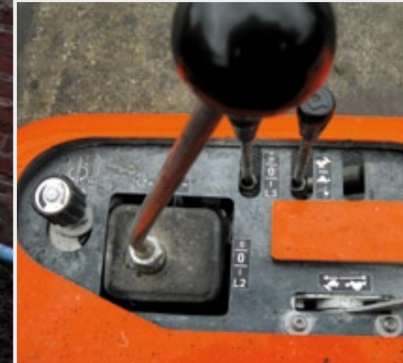
De bediening. Voor de kruishendel zit een draaiknop om de hydrostaat te smoren.