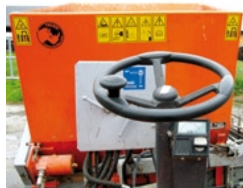
Het uitzicht vanaf de stoel. Rechts onder het stuur de digitale toerenteller en het contactslot. Ook zijn de twee driewegkranen te zien waarmee de strooiselverdeler bediend wordt.

bedien je met een functie op de kruishendel. De opstap van de Trac is ruim voldoende. Rechts naast de niet-geveerde stoel is de kruishendel van de hydrauliek en hef te vinden en eventueel een hendel voor de optionele extra functie. Ook zijn er het