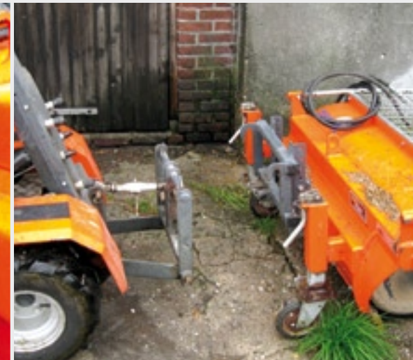
Het aankoppelen van een werktuig is eenvoudig, met de topstang kan de snelwissel neigen.