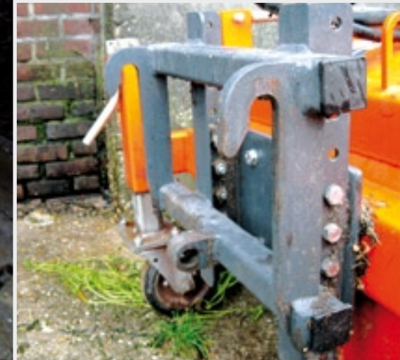
De snelkoppeling aan de machinekant. Geen iele stukjes metaal maar drie degelijke aankoppelpunten.