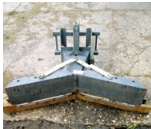
De mest/modderschuif is in verschillende posities te verstellen. Deze optie is ook hydraulisch leverbaar.

Standaard is de machine voorzien van een dubbelwerkend ventiel en een drukloze retour. Een tweede dubbelwerkende functie is een optie. Aan de voorzijde van de machine zit een snelkoppeling voor de aankoppeling van werktuigen. De hefarmen