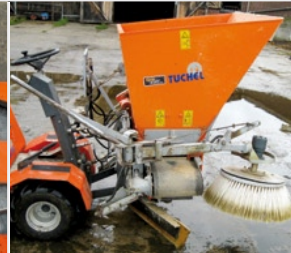
De strooiselverdeler. De band kan handmatig in- en uitgezwent worden.