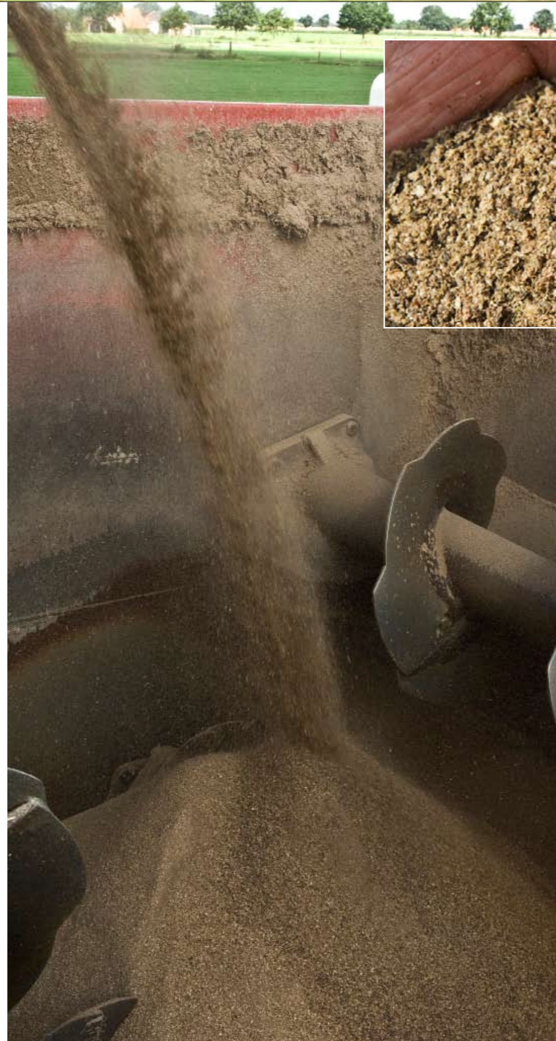
Een ruwvoermix bestaat uit niet-geperste veevoedergrondstoffen en kan voor een deel ruwvoer vervangen

Volgens Van Engelen is een ruwvoermix dit jaar een beter alternatief dan het aan-