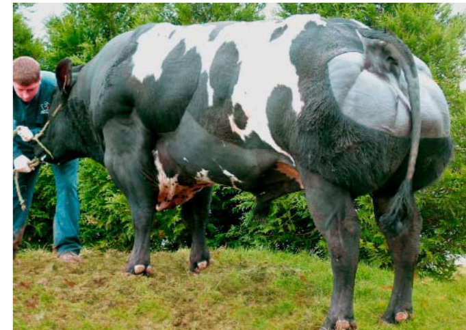
Fleuron staat voor groeikracht