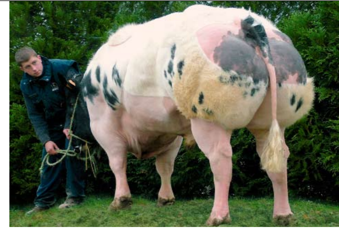
Beloftevolle cijfers voor Obelix d'Ochain

het dwerggroeigen, maar laat daar bij zijn nakomelingen weinig van merken, niet bij de geboorte en ook niet op veertien maanden ouderdom. Punten van aandacht zijn evenwel een verhoogde aanwezigheid van gebrekkige voorpoten (110), dikke tongen (117) en scheve muilen (113) bij de kalveren. Daartegenover staan op latere leeftijd 'plaatjes van koeien' die bovengemiddeld scoren op alle exterieurkenmerken. |