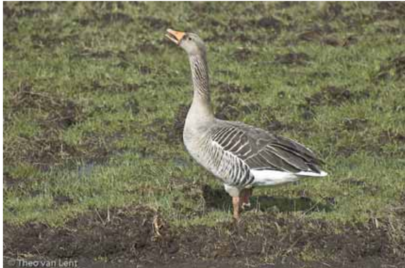
Grauwe gans.