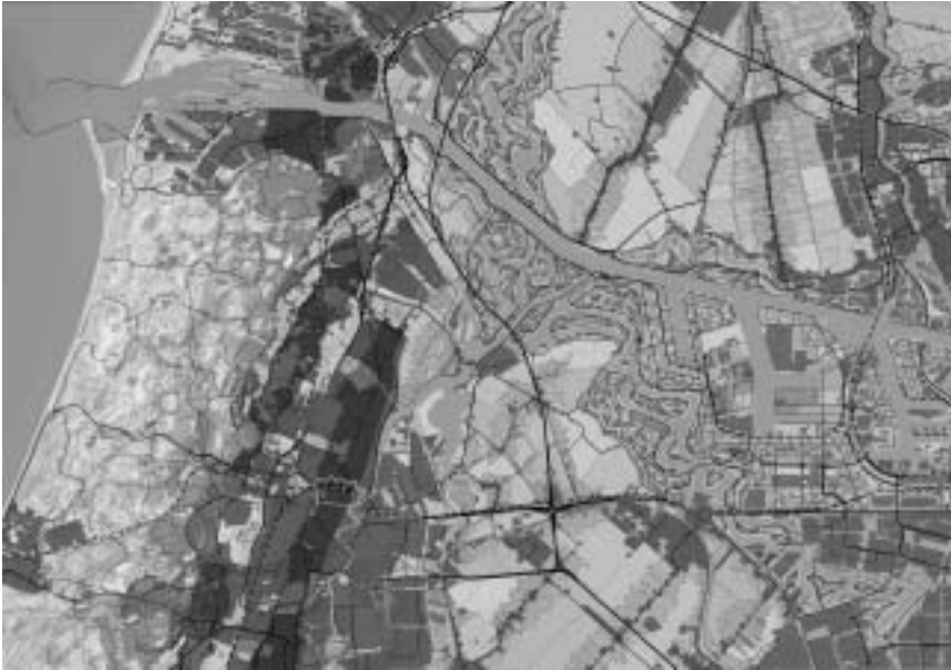
De Plankaart is zo gedetailleerd, dat het een topografische kaart van 2030 zou kunnen zijn.

heeft, wat er mee aan te vangen. Dus wordt gekozen voor een behoudzuchtige koers, waarbij de karakteristieken van de 'authentieke cultuurlandschappen' behouden moeten blijven. Moderne landbouw is daarin ineens niet vanzelfsprekend meer; recreëren mag, maar wel op wegen en paden; de natuur houdt zich op in de slootkant. De rode contour rond de stad en de groene contour rond de natuur betekenen feitelijk een gele contour rond het platteland: dit is het gebied waar eigenlijk niets mag, maar van alles zou kunnen, al weet geen mens wat en hoe.