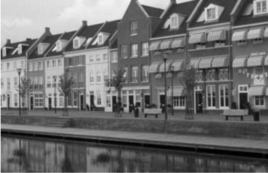
Een beeld van Brandevoort: retrostijl als schoonheid, losgemaakt van tijd en plaats.