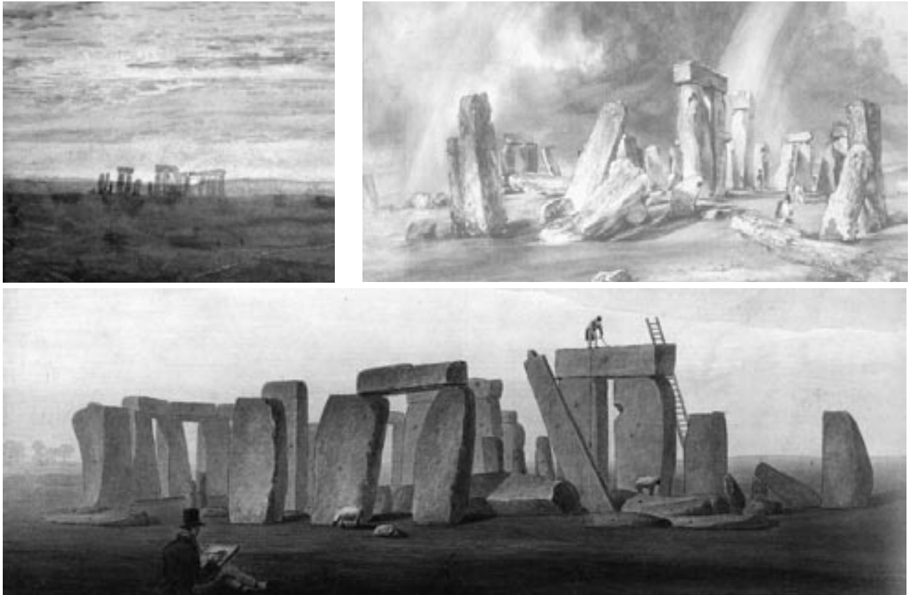
Fig. 2: Stonehenge, links: Turner, rechts: Constable, onder: Sir John Soane