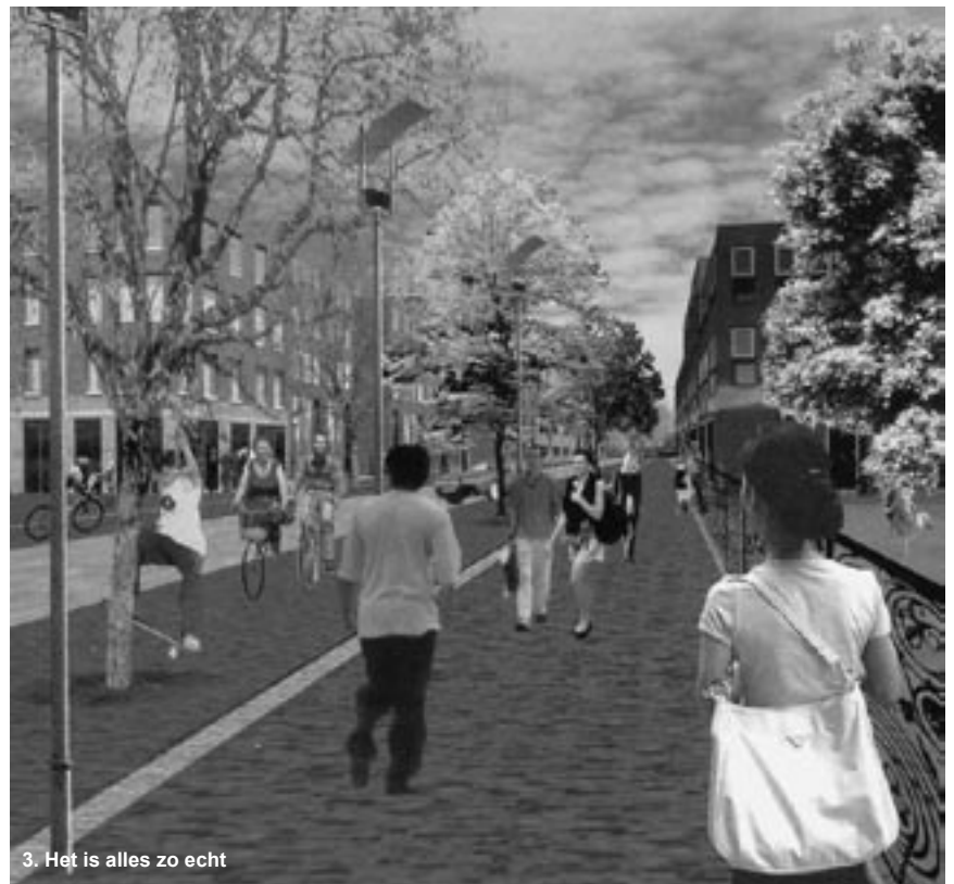
3. Het is alles zo echt

Lodewijk Wiegersma is a landscape architect who has worked in the Nether-