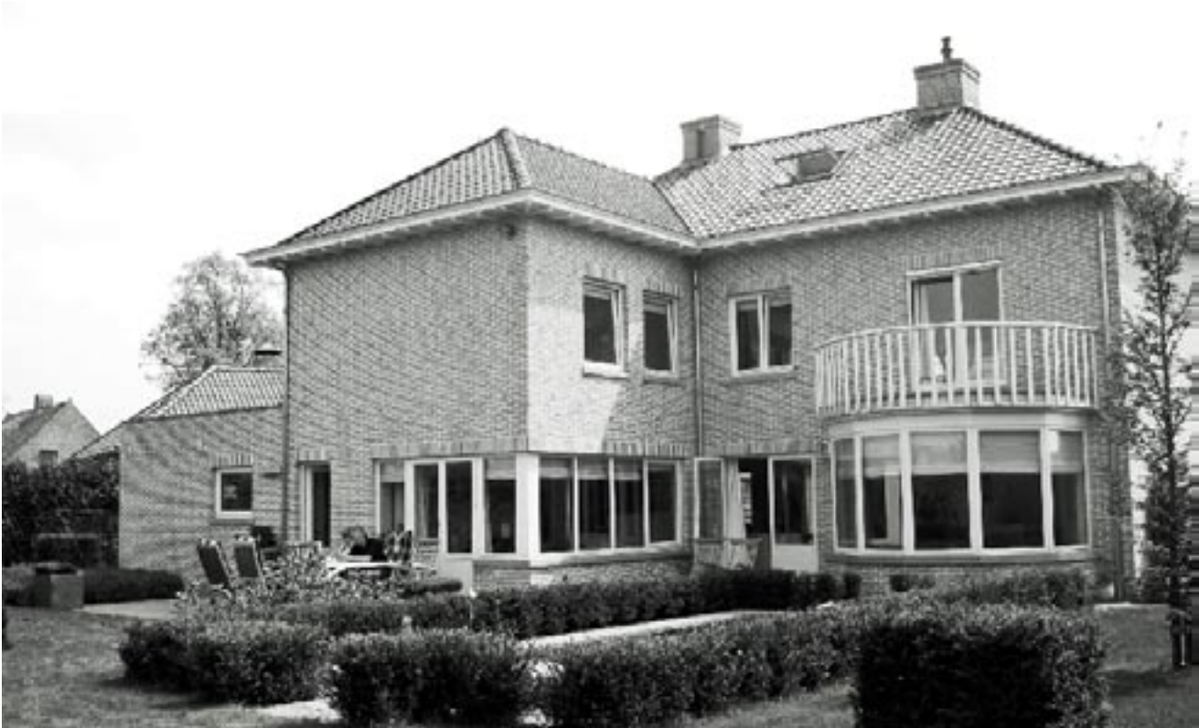
Villa op het Vlaamse platteland

lijkt alsof de problematiek die in ruimtelijke ordening en ontwerp aan de orde wordt gesteld steeds meer gericht is op: het oplossen van interne systeemproblemen (hoe stuur ik?); esthetiek (wat is mooi?); systematiek en orde (past dit hier?); en financiering (wie betaalt?). Over smaak valt niet te twisten, het geld geeft uiteindelijk de doorslag, en het sturingsprobleem blijft bij een andere beleidsagenda voortbestaan. Hierom putten deskundigen zich steeds meer uit in het maken van utopieën, creatieve sprongen, innovaties, nieuwe netwerken en communicatiestrategieën. Vanuit een sociaal-wetenschappelijk standpunt bezien is het jammer dat we hierdoor zo weinig weten over de alledaagse relatie tussen mens en ruimte en wat mensen nu werkelijk belangrijk vinden.