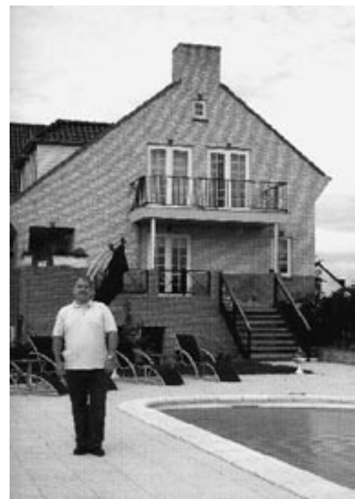
Het nieuwe wonen op het platteland

Als we architectuurcritici mogen geloven is niemand tevreden met het resultaat. Nederland verrommelt, slijt dicht, is smakeloos en saai. Niets deugt, en het is allemaal de schuld van het systeem. Op zich is dit allemaal prima, maar waar zijn de gebruikers? Wat vinden die honderdduizenden werknemers van bedrijventerreinen van hun werkomgeving? Inmiddels wonen miljoenen mensen in nieuwbouwcomplexen. Bevalt het daar? Hoe is het leven? Waarom gaan mensen zo graag naar perifere woonboulevards en pret-centra? Niet omdat het zo lelijk is. "Winkelen wordt nog eentoniger", luidt een recente krantenkop. Het monotone straatbeeld wordt veroorzaakt door de opkomst van standaard winkelformules. De detailhandel weet wel waarom: klanten houden niet van verrassingen. "Dit is wat de consument wil". Met een populistisch standpunt schieten we natuurlijk ook niet veel op, maar het