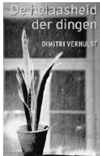
Voorkant "De helaasheid der dingen"

De objecten representeren een ontkenning en afwijzing van de locale morele orde; het zijn symbolen van afwijzing. Lokale bewoners associëren objecten met actoren, met hun houding en gedrag, met hun sociale betekenis. Dit werd mij duidelijk uit een latere episode uit het boek.