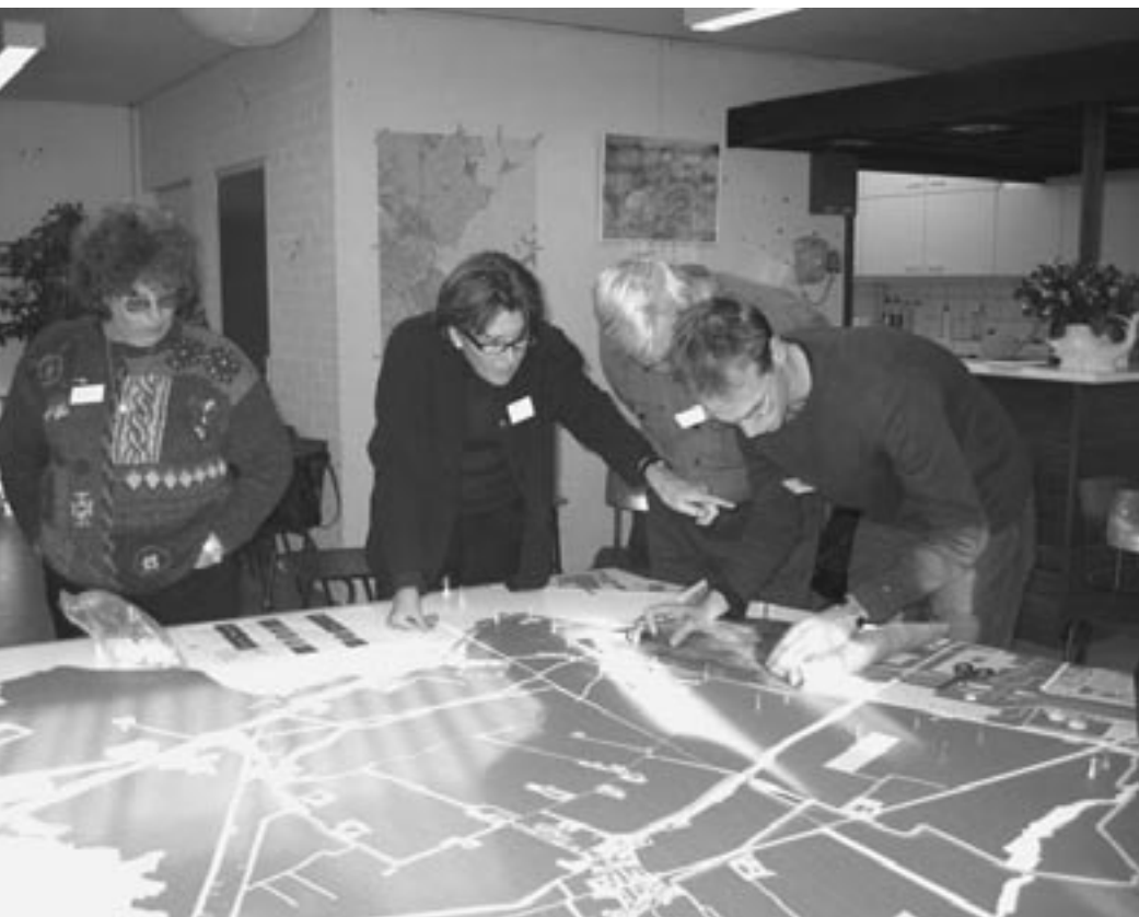
Participatie in de praktijk: natuurontwikkelingsplan Waterland

maar het contact met de mensen die mede die identiteit vormgeven en het gebied het beste kennen werd nooit gelegd. Door juist met die mensen te praten krijg je handvatten aangereikt die je helpen bij het ontwerpen. Die eerste fase is dus heel erg waardevol.