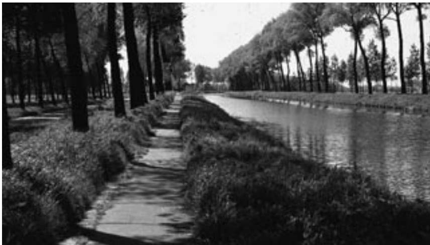
7. Functionele schoonheid, het Albertkanaal, België