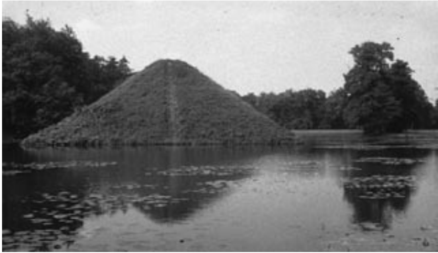
6. Tijdloze vorm, de see-pyramide, Branitz park, Cottbus, Duitsland