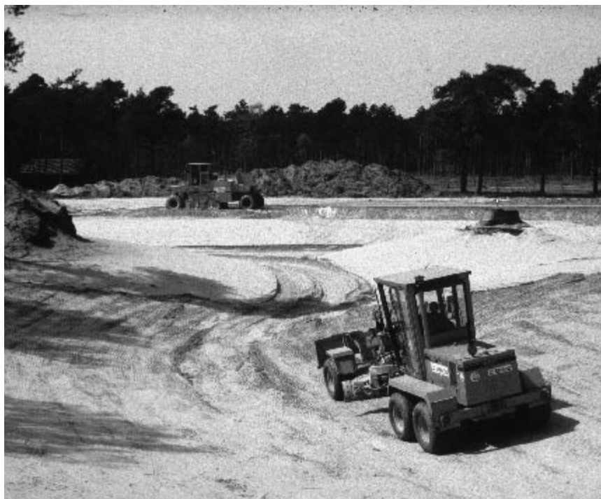
1. Landschapsarchitectuur en het zandbakgevoel, de aanleg van een kunstmatig ven (Nationaal Park de Hoge Veluwe)

Klaas Kerkstra Docent bij de leerstoelgroep Landschapsarchitectuur klaas.kerkstra@wur.nl