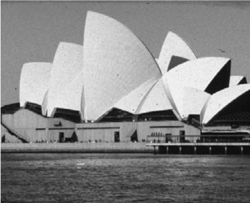
5. Wat is de stad zonder architectuur? Opera House, Sidney

lutie van de creatieve geest" (Amsterdam University Press). Geen rechtvaardiging voor ongepast gedrag natuurlijk, maar het valt ook niet te ontkennen dat de individualiteit van de ontwerper een wezenlijke factor is in het creatieve proces. Cultivering van de individualiteit is voor de architect in dit opzicht een noodzaak. De voorbeelden van hoe dit ook uit de hand kan lopen heeft iedereen wel voor handen. Beroepsdeformatie ligt altijd op de loer. Maar een architect moet buiten de kaders durven denken en van zichzelf overtuigd zijn. Anders komt hij nergens. Maar hij moet wel zijn rol kennen: architectuur is een dienend vak, anderen beslissen.