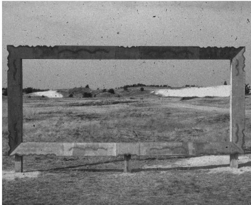
2. Stuiifzand: van ecologisch ramp tot waardevol cultuurlandschap, hoe vluchtig is het waardeoordeel?! (Nationaal Park de Hoge Veluwe)

1. Voor de architect geldt in zekere zin hetzelfde als voor de dichter, waarvan Aristoteles (Poëtica 51936) ter verdediging stelt: “(.) dat het niet de specifieke taak van de dichter is te spreken van