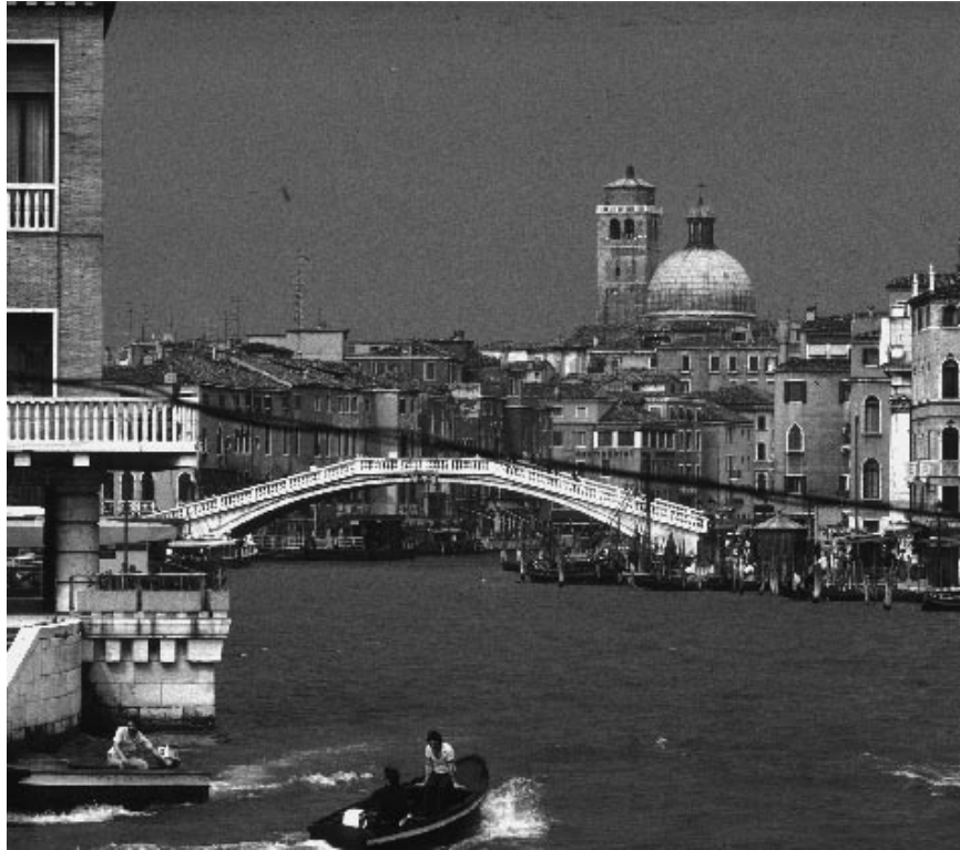
9. Het landschap in de stad, Canal Grande, Venetië

In this essay Klaas Kerkstra elaborates on the position of the landscape architect in relation to the people and the landscape. The work of a landscape architect is always influenced by people. Before judging the work of the landscape architect, Kerkstra offers five points of contemplation. Architects work with something that does not exist. The architect is not responsible for whether or not a design will be built. Other people decide. And although the work of an architect is to serve, imagination and creativity are needed. Architecture is meant for people because the design is about the space in which people live. Architecture is built with an ideal; a design serves both material and immaterial needs.