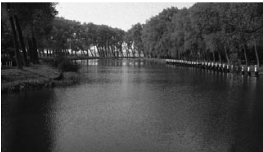
8. Het schone van de eenvoud, de haven van Sluis, Zeeuws Vlaanderen