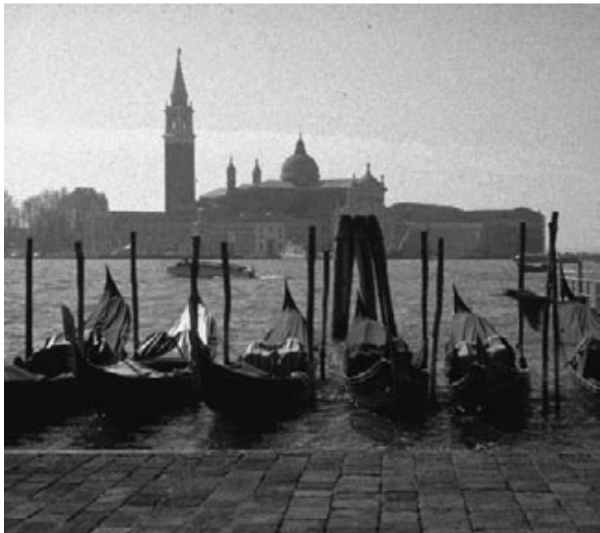
10. Het landschap, de stad en Palladio, dichter bij het ideaal kan ik mij nauwelijks voorstellen