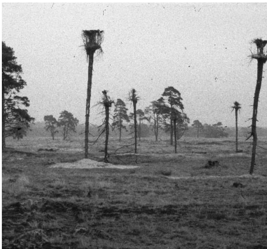
3. De wereld klopt, als je hem ondersteboven ziet, omgevingskunst (Nationaal Park de Hoge Veluwe)