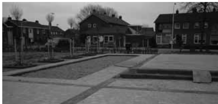
Wanneperveen, functionele inrichting

Aan de hand van deze vijf onderscheidde onderdelen van dorpspleinen zijn voor het onderzoek een drietal case-studies in Overijssel uitgewerkt: te weten Creil, Deurningen en Wanneperveen. De drie casestudies varieerden in de situatie van het plein. Het plein in Creil is al jaren hetzelfde, het plein in Deurningen is in ontwikkeling en het plein in Wanneperveen is recentelijk aangelegd. Om de analyse uit te kunnen voeren is