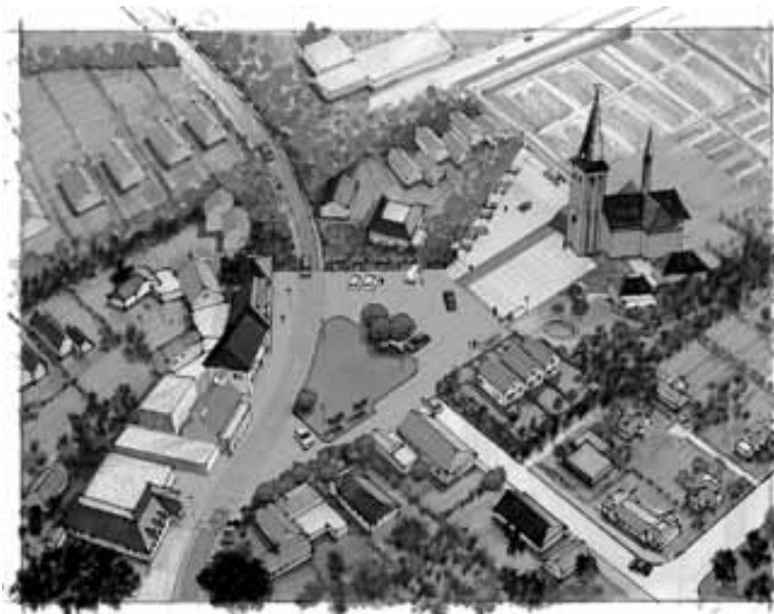
Ontwerp voor het plein in Deurningen