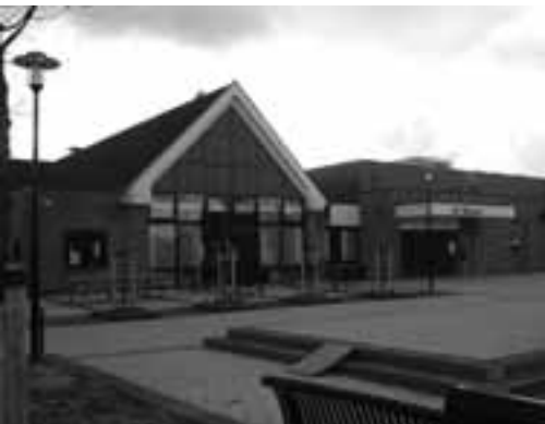
Het dorps huis gelegen aan het plein in Waneperveen