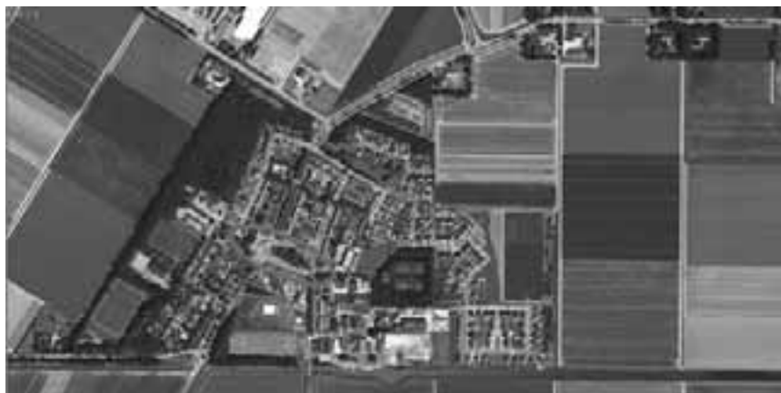
Centrale ligging plein in het dorp Creil

Het leven is individueler geworden maar het verenigingsleven bloeit nog steeds. Het plein is dé plek van het dorp waar de evenementen georganiseerd kunnen worden. In Nederland zijn verschillende typen pleinen te onderscheiden. Deze kunnen worden ingedeeld naar ruimte, gebruik, ligging of het ontstaans- en ontwikkelingsproces. De oorsprong van het plein ligt in de klassieke beschaving. De Griekse polis bloeide rond de 5de eeuw voor Christus en de Romeinse stad begon rond de 3de eeuw voor Christus te bloeien. Het plein werd gewaardeerd als ruimte voor sociale interactie en biedt ook tegenwoordig de mogelijkheid om te communiceren. Daarnaast wordt het plein vaak gezien als het centrum en staat het symbool voor de stad. Het