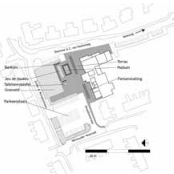
De indeling van het plein in Wanneperveen