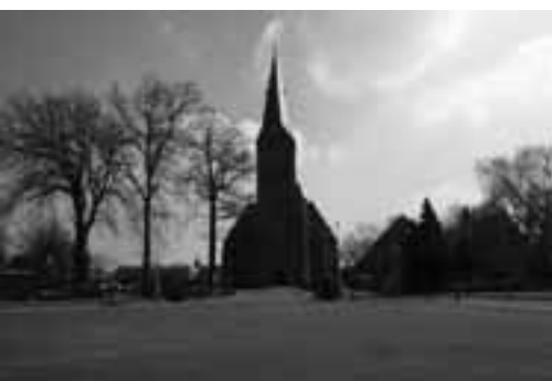
Plein Deurningen met kerk als markering

mensen aan. Mensen ondernemen verschillende typen activiteiten. Onderscheid wordt hierin gemaakt tussen noodzakelijke en toevallige ontmoetingen. Van de inrichting van het plein wordt verlangd dat deze activiteiten mogelijk zijn. Het plein moet makkelijk te bereiken en te passeren zijn voor verschillende vormen van vervoer. Voor de auto is het belangrijk dat men deze kan parkeren en dus moet het plein vlak zijn en verhard. Om mensen te kunnen laten verblijven op een plein is het belangrijk dat er zitmogelijkheden zijn. De bewoners geven op de vraag over hun ideale dorpsplein ook aan dat daar bankjes aanwezig moeten zijn. Het is belangrijk dat wanneer gekozen wordt om de verkeersstromen te scheiden dit