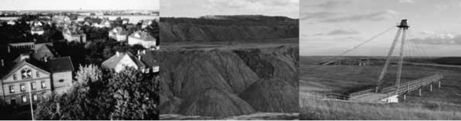
Figuur 1: Bückgen, vroeger onderdeel van het stadje Großräschen, en de bruinkoolmijn die het gebied daarna was (foto 2005). Nu de bruinkoolwinning gestopt is, zijn er plannen voor de aanleg van een meer met recreatie, natuurontwikkeling en de winning van zonne-energie. De pier staat er alvast, hoewel het water pas in 2015 de eindwaterstand zal bereiken.

overblijven in het landschap, ter grote van het volume bruinkool dat is gewonnen.