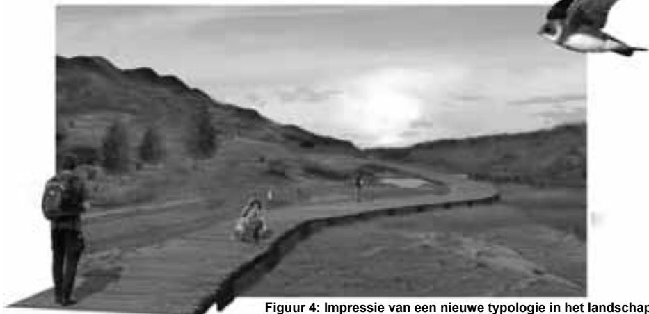
Figuur 4: Impressie van een nieuwe typologie in het landschap

The mine Klettwitz remained unrehabilitated for a long time since it was closed in 1991. Many of the old brown coal sites are rehabilitated today. As an alternative for the current engineering approach to mine site rehabilitation in Lusatia, more ecologically, landscape based measures are proposed. To address not only the environmental problems caused by the mining, a landscape narration (chronicle and memoires) has been designed to tell the history of this area and to establish identity in the new landscape. According to a trend analysis into land uses that will be important for the future, sustainable energy provision, nature development and recreation form the main part of this plan. These land uses make the plan also economically functional.