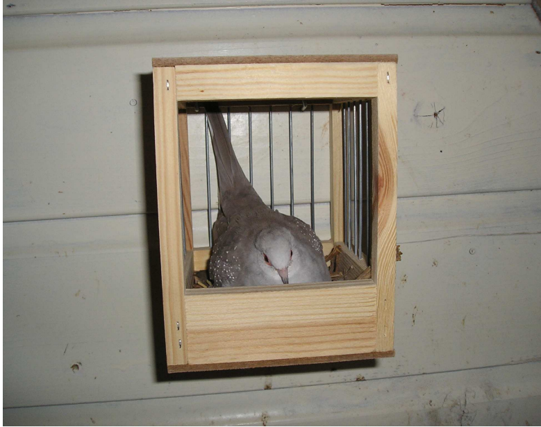
Fig. 13 Een pastel duivin volop aan het broeden

De jonge duiven worden door beide ouders gevoerd met duivenmelk of kropmelk. De productie hiervan komt langzaam op gang als de jongen zijn geboren en neemt daarna ook al snel weer langzaam af. Gaandeweg worden ook zaden aan het menu toegevoegd. Ook wat insectenvoer of wormpjes worden graag bijgevoerd.