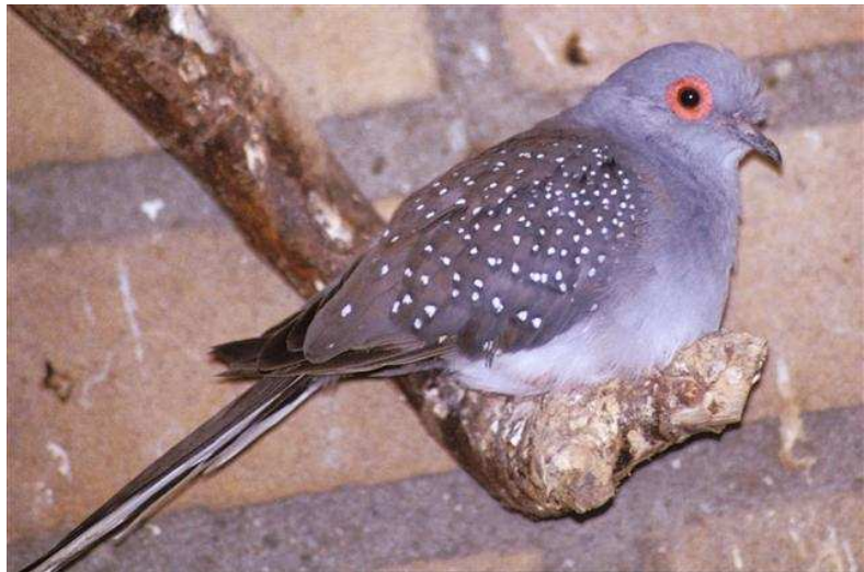
Fig. 3 Diamantduif doffer wildkleur

De vleugels zijn donkergrijs met gebogen regelmatige rijen witte stippen of vlekjes.