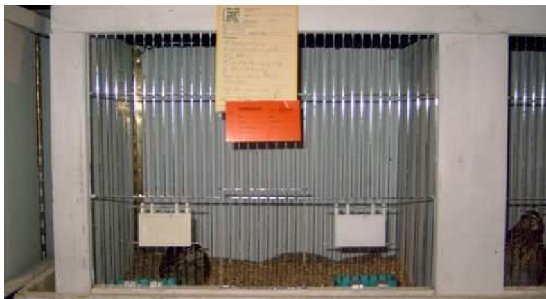
Fig. 22 Tentoonstellingskooi met keurkaart en een rode Verkocht-kaart

Wordt een dier verkocht, dan hangt een medewerker van de tentoonstellingsorganisatie op die kooi een rode Verkocht-kaart.