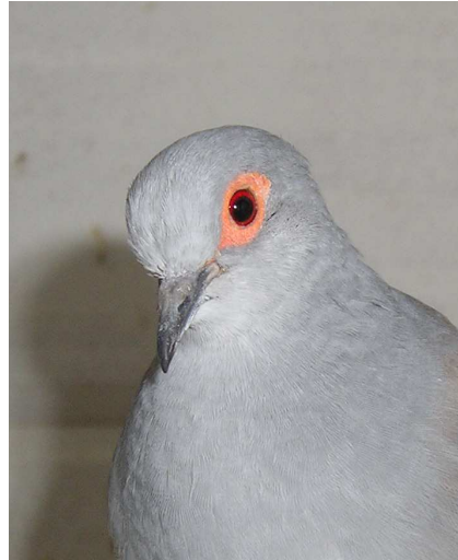
Fig. 2 Kopstudie diamantduif doffer wildkleur

Kortom, diamantduiven zijn mooi, klein, gemakkelijk, levendig, verdraagzaam en vlug vertrouwd met de verzorger.