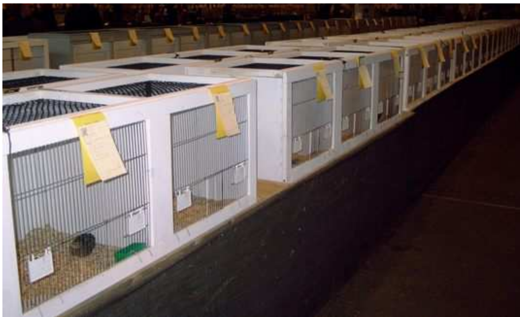
Fig. 21 Tentoonstellingskooien voor kleine siervogels

De inzender (of de vervoerder) plaatst de dieren in de kooien. De kooigegevens staan op de etiketten. De transportkist wordt onder de kooien plaatsen. De lege transportkisten blijven dus tijdens de kleindierententoonstelling onder kooien staan.