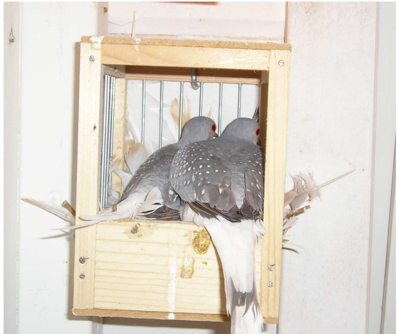
Fig. 11 Dit soort kleine half open nestkastjes worden graag gebruikt. Een wilkleur-witstuit koppel is druk bezig

Daarna legt de duivin kort achter elkaar twee crèmekleurige eieren die door beide ouders worden bebroed. Meestal broed de doffer overdag en de duivin 's nachts. De doffer komt vaak elke dag op dezelfde tijd de duivin aflossen. Meestal komen de eieren rond de 13 de broeddag uit. Een broedsel bestaat vaak uit een doffer en een duivin.