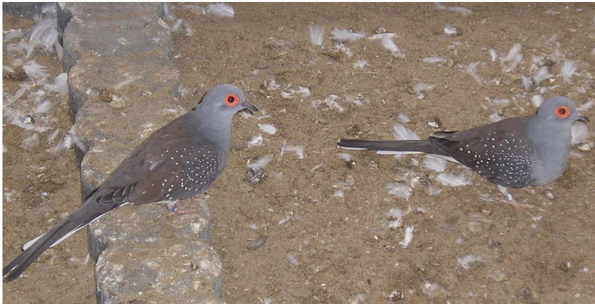
Fig. 9 Een koppel wildkleur diamantduiven scharrelend op de grond

Op de bodem van het hok of de volière kan zo nu en dan een platte schaal met wat water geplaatst worden. Na het baden wordt dit water weer weggehaald, zodat de dieren geen badwater kunnen drinken.