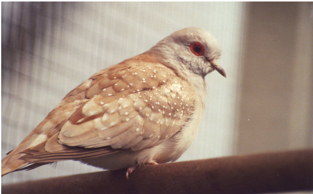
Fig. 5 Diamantduif bruin duivin

Bij bruin-witstuit zijn het onderste deel van de rug en de stuit wit. De kleur van de andere lichaamsonderdelen is dezelfde als bij bruin.