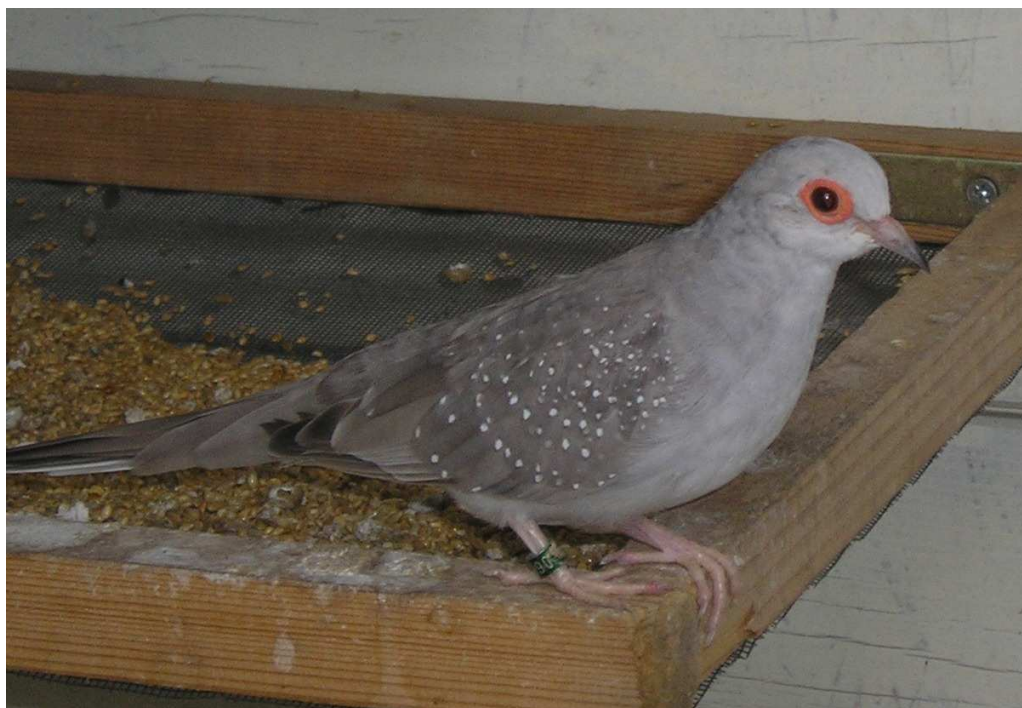
Fig. 6 Diamantduif pastel doffer

Het donker blauwgrijs bij de wildkleur is bij pastel vervangen door zilvergrijs. De snavel is grijs en de nagels zijn lichtgrijs.