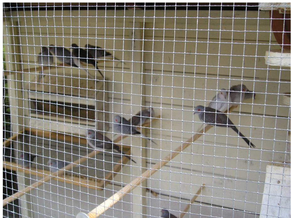
Fig. 8 Een kleinere volièrre met jonge diamantduiven

Diamantduiven zijn vreedzame vogels die zonder problemen samen gehouden kunnen worden met zangvogels of kwartels. Het is zelfs mogelijk meerdere paren bij elkaar te houden, hoewel de volièrre dan wel groot genoeg moet zijn. De mannetjes kunnen tijdens de broedperiode nog wel eens tegen elkaar uitvallen.