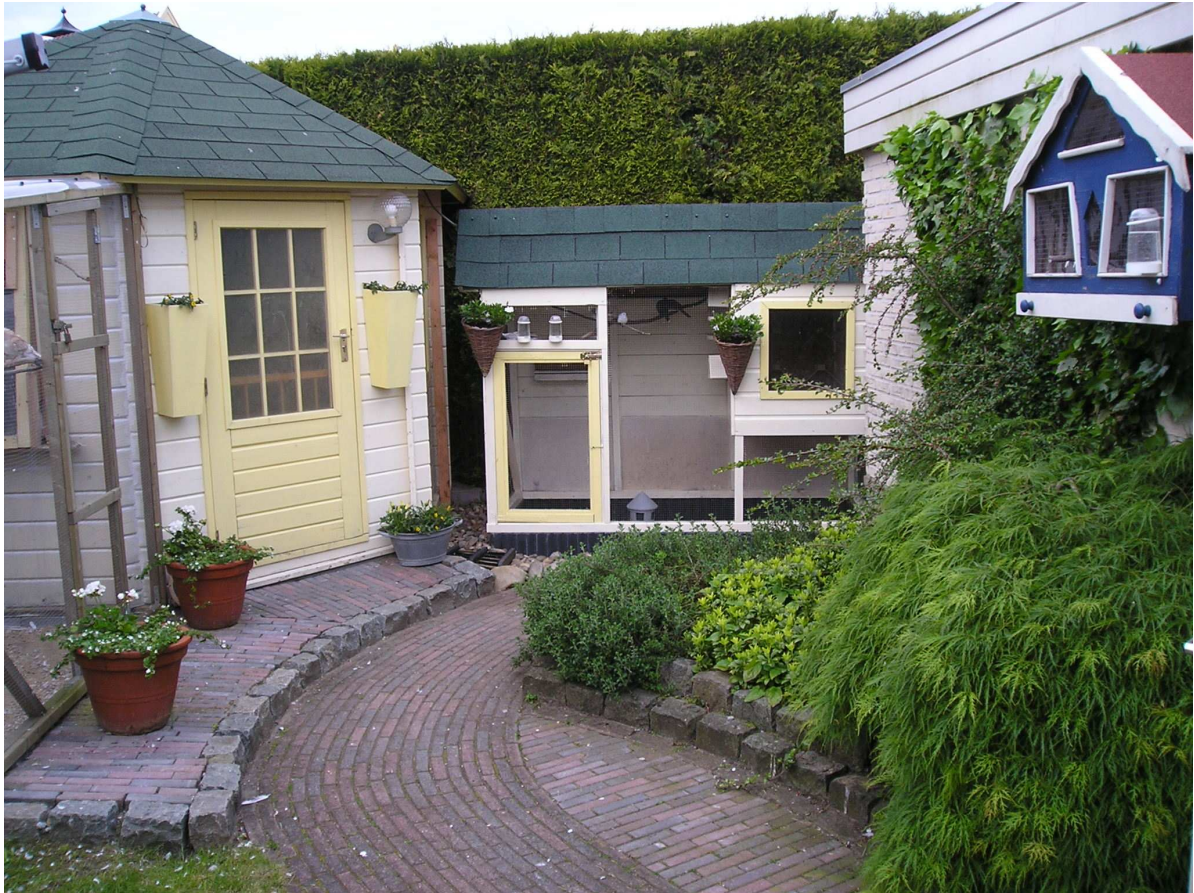
Fig. 7 In het midden een volièrre voor diamantduiven

Diamantduiven worden ook wel permanent binnen gehouden in een binnenvolière of in kleinere kooien. Er zijn dan geen problemen in het koude jaargetijde.