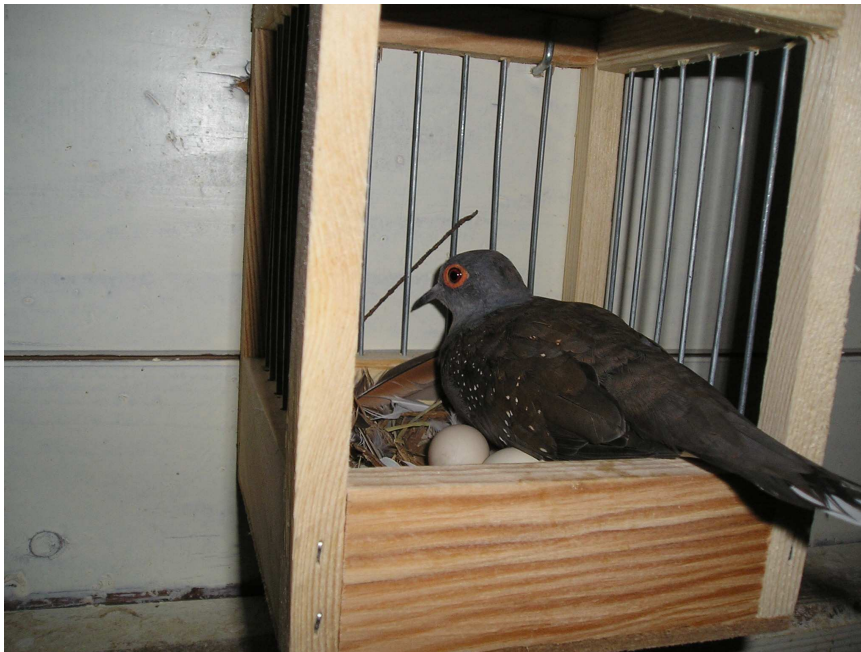
Fig. 12 Een wildkleur duivin met haar twee eieren

Daarna legt de duivin kort achter elkaar twee crèmekleurige eieren die door beide ouders worden bebroed. Meestal broed de doffer overdag en de duivin 's nachts. De doffer komt vaak elke dag op dezelfde tijd de duivin aflossen. Meestal komen de eieren rond de 13 de broeddag uit. Een broedsel bestaat vaak uit een doffer en een duivin.