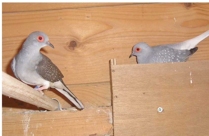
Fig. 10 Een koppel diamantduiven wildkleur witstuit onderzoekt een nestbakje

Wordt een koppel samengesteld, dan balst de doffer voor de duivin. Bij de balts koert de doffer voor de duivin, buigt de kop naar de bodem, blaast zijn borst op en waaiert met de staart. De duivin gedraagt zich heel wat rustiger en zal zo nu en dan ook wat gekoer laten horen. Na verloop van tijd paart de doffer met de duivin.