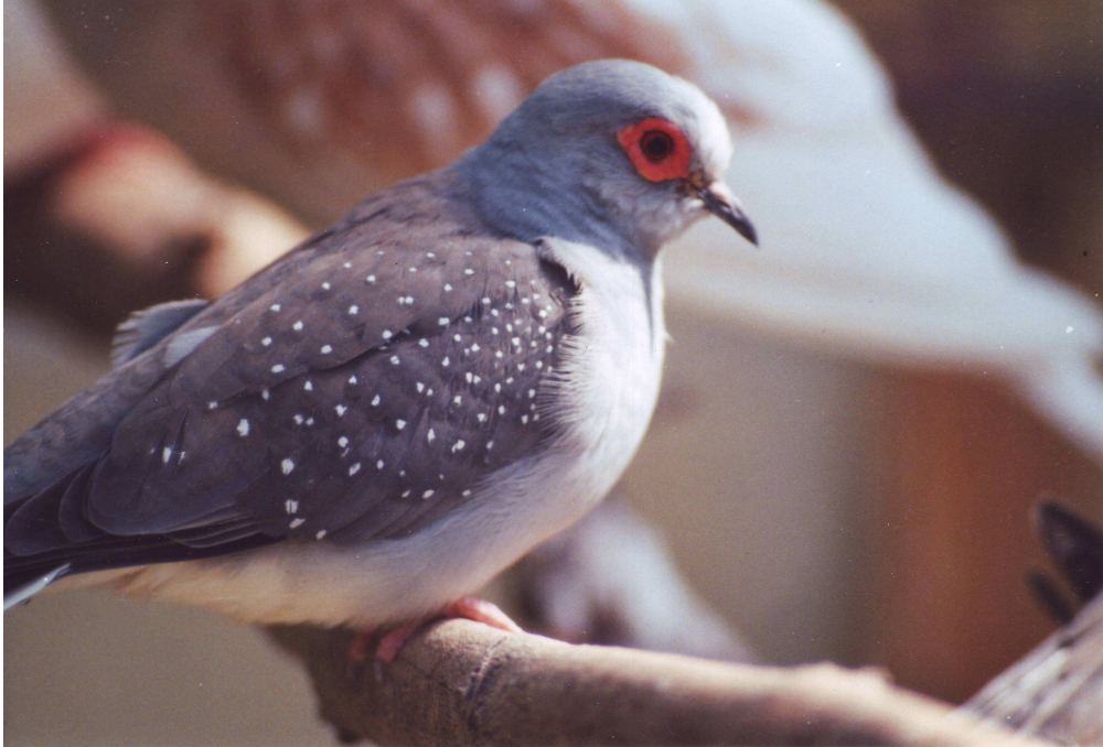
Fig. 1 Diamantduiven zijn echte zoonanbidders (doffer wildkleur)