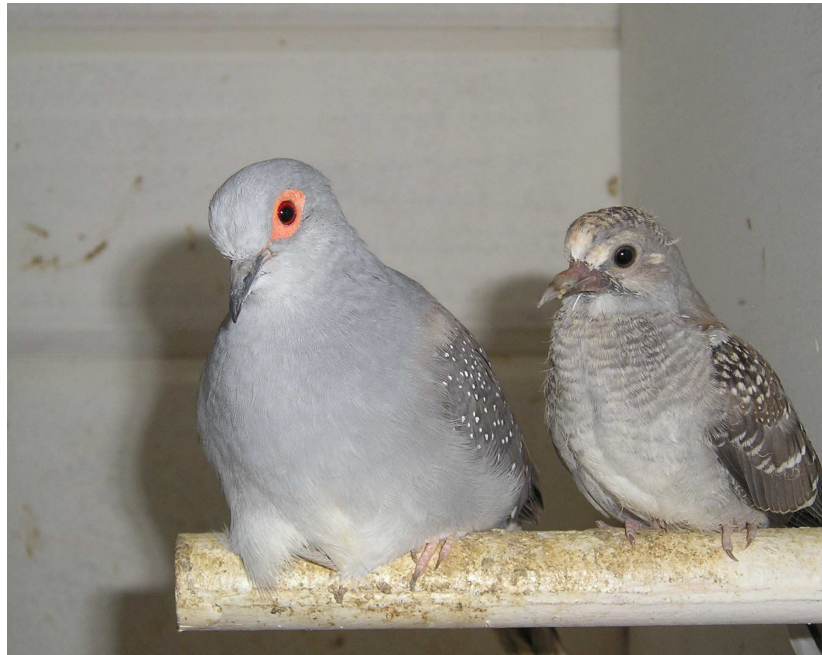
Fig. 16 Wildkleur duivin met een jong van drie weken oud.

Na twee maanden zijn de 'jonge' duiven al niet meer te onderscheiden van de ouders. Op een leeftijd van vier tot vijf maanden zijn de jonge duiven in staat om zelf al weer voor nageslacht te zorgen. De jonge duiven kunnen bij de ouders blijven zolang zij de ouders niet storen bij het volgende nest. Vaak is het beter om de jonge dieren apart te huisvesten.