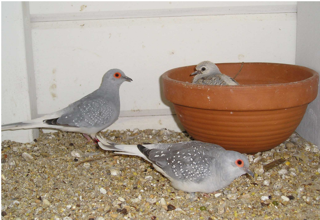
Fig. 14 Een koppel diamantduiven met hun jong in de broedschaal

Jonge diamantduiven groeien verbazingwekkend snel en op dag tien of elf vliegen de jonge duiven al. Drie weken later beginnen de jonge dieren al te verkleuren. Voor de rui zijn de jonge duifjes van de doffers te onderscheiden aan de meer bruine kleur van kop en hals. Na de rui zijn de geslachten moeilijker vast te stellen. Het spreiden van de staart is dan het beste herkenningsteken van de doffer.