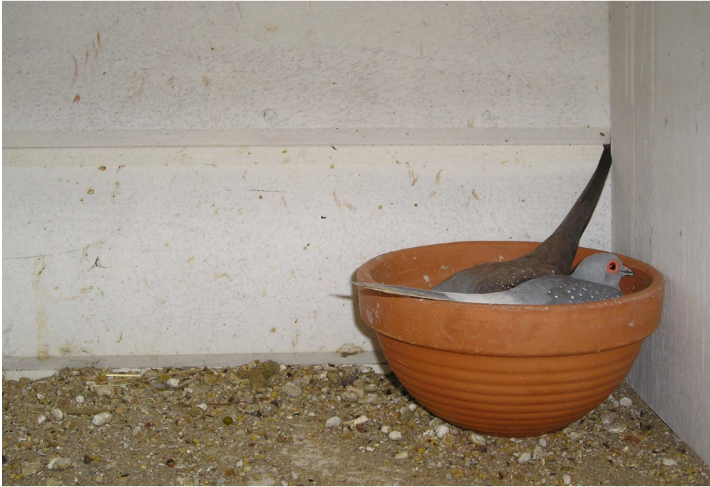
Fig. 15 Met z'n allen lekker in de broedschaal

Na twee maanden zijn de 'jonge' duiven al niet meer te onderscheiden van de ouders. Op een leeftijd van vier tot vijf maanden zijn de jonge duiven in staat om zelf al weer voor nageslacht te zorgen. De jonge duiven kunnen bij de ouders blijven zolang zij de ouders niet storen bij het volgende nest. Vaak is het beter om de jonge dieren apart te huisvesten.