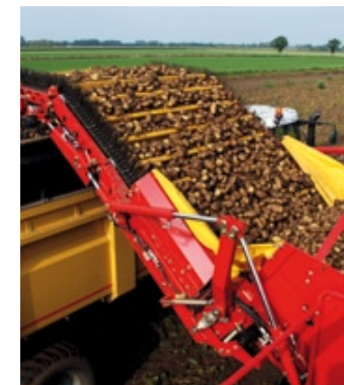
▲ De bunker is voorzien van een bunkerband en knikkende losband die in de kippers kan reiken.