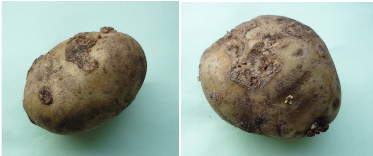
Afbeelding 1 en 2: Poederschurftsymptomen op de knol. Eerst komt het weefsel omhoog en later zakt het in.

De onderwatergewichten waren hoog in 2008 voor Première. Ook waren er significante verschillen tussen de objecten. In 2007 was dit niet het geval. Ook van deze verschillen is zo niet aan te geven wat hiervan de oorzaak geweest kan zijn.