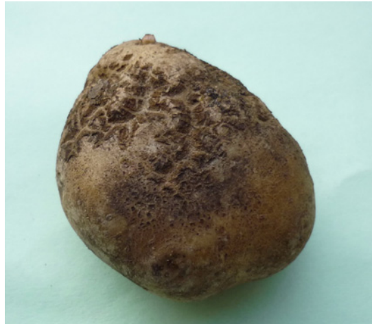
Afbeelding 5 en 6: Afbeelding 5 is een knol met dikke sclerotiën van Rhizoctonia solani . Op de schil komen ook zwarte spikkel en zilverschurft voor. Het verkurkte weefsel op afbeelding 6 is wellicht door Rhizoctonia solani veroorzaakt.