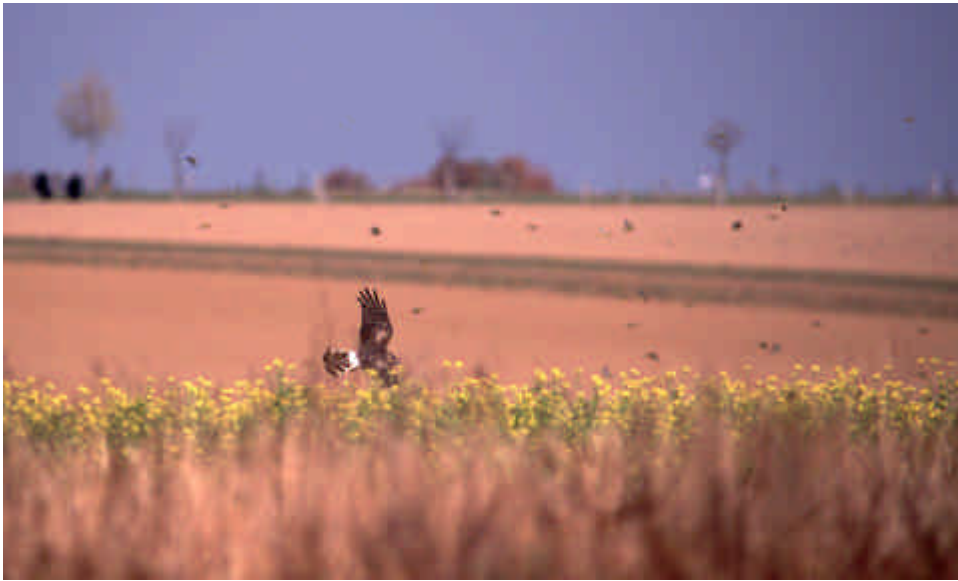
Blauwe kiekendief jagend tussen een wolk van geelgorzen