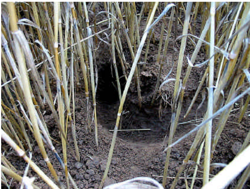
Hamsterburcht in wintergraan

De evaluatie is gericht op de mate waarin de actiepunten/maatregelen zijn opgepakt of uitgevoerd en de effecten hiervan. De evaluatie moet daarmee inzicht verschaffen in de mate waarin de in het beschermingsplan genoemde doelstellingen zijn gehaald. Het is een aparte rapportage, volgend op vier jaar uitvoering van het Beschermingsplan. De evaluatie besluit met een advies voor het laatste jaar 2010 en voor een mogelijk vervolg in planvorming en/of uitvoering.