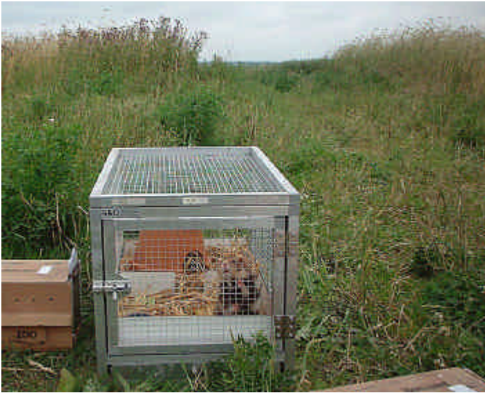
Hamster, klaar om te worden uitgezet