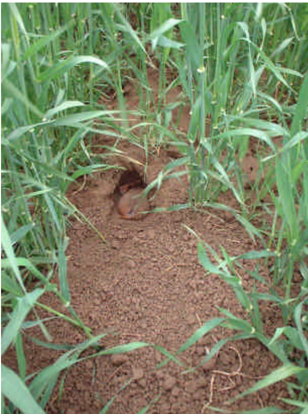
Hamster bij ingang hamsterburcht