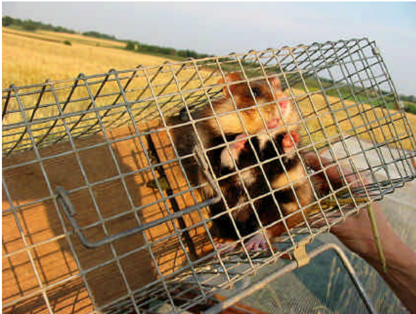
Gevangen hamster