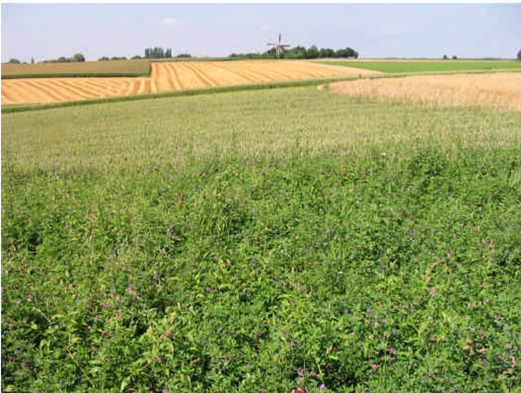
Hamsterleefgebied in Limburg

5: Realiseren van voldoende maatschappelijk draagvlak voor bescherming van de hamster.