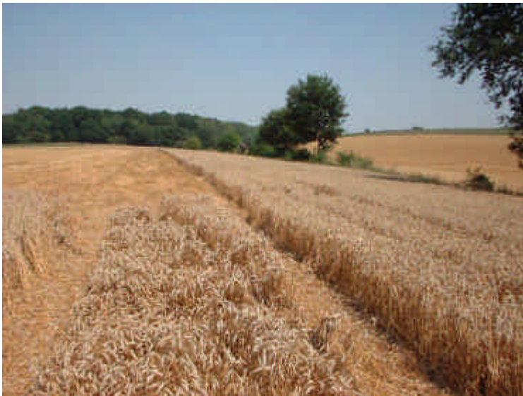
Opvangstrook in wintergraan

Voor algemene voorlichting en educatie over de hamster wordt een website ontwikkeld, toegesneden op een breed publiek. Daar wordt informatie gegeven over het beleid van de overheid, regelgeving rond de hamster, internationale afspraken en verdragen, beleidsdoelstellingen, geplande en in uitvoering zijnde beschermingsmaatregelen, de ecologie van de soort, onderzoeksresultaten en de effecten van het beschermingsplan.