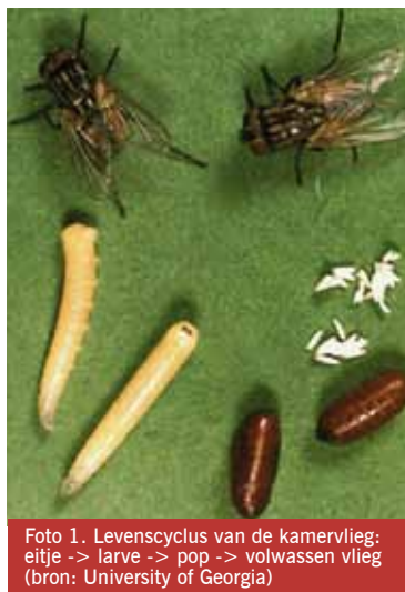
Foto 1. Levenscyclus van de kamervlieg: eitje -> larve -> pop -> volwassen vlieg (bron: University of Georgia)