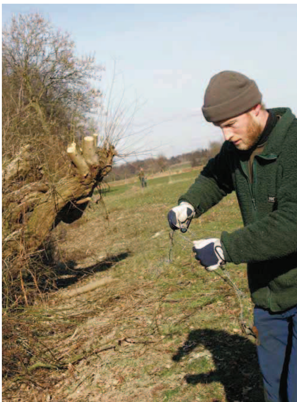
Nederland wil boeren gaan betalen voor het onderhoud van het landschap.

samenleving wel van profiteert maar waar de boer nu niets of weinig voor terugziet. Door niet de productie van voedsel te subsidiëren of op basis van historie subsidie te verdelen is ook beter uit te leggen waarom er belastinggeld naar de landbouw gaat. Zo is het geen staatssteun voor een economische sector,