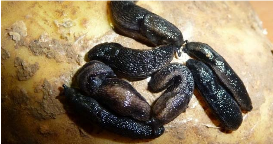
Foto 1. De donkere en zwarte weglakken.

De gele kielnaaktslak ( Tandonia sowerbyi ) wordt met schade aan aardappelknollen in verband gebracht (foto 2). In een partij aardappelen werd één individu aangetroffen.