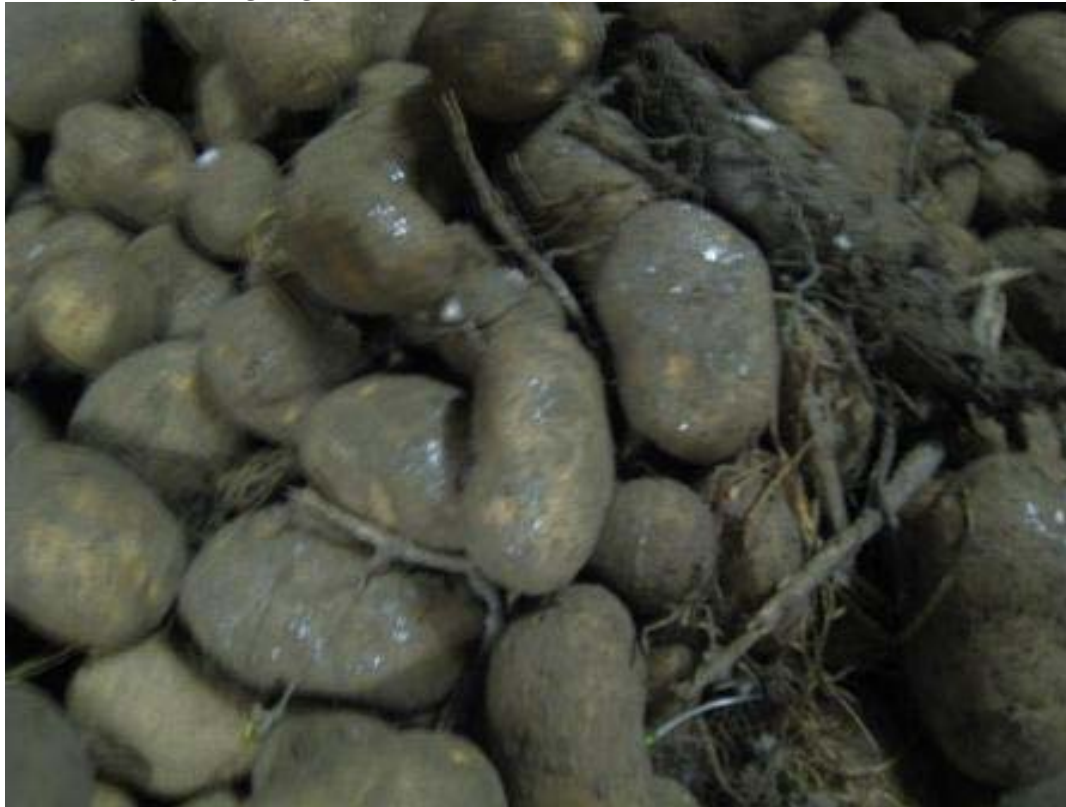
Foto 10. Slijmsporen getuigen van slakkenactiviteit.

Respondenten zijn gesplitst in bedrijven met en zonder problemen. Telers met problemen hadden schade waarbij meer dan 2% van de aardappelen waren aangetast. Nul tot maximaal 40 % schade wordt gemeld. Toenemende schade verhoogt de kosten van uitsorteren, te veel schade maakt een partij onverkoopbaar. Uit het onderzoek blijkt dat de problemen met slakken in aardappelen niet op alle bedrijven hebben plaatsgevonden. Op bedrijven met problemen komt schade ook niet op alle percelen voor. Slakkenvraat in aardappelen wordt voornamelijk de laatste drie jaar in Zuid-Limburg gemeld met 2008 als hoogtepunt. In hoeverre de problemen toenemen is niet vast te stellen. Of het probleem bedrijf- of perceelsgebonden is moet nog blijken de komende jaren. Immers, om de zoveel jaar komen de aardappelen terug op hetzelfde perceel, terwijl dit fenomeen niet in andere gewassen wordt signaleerd.