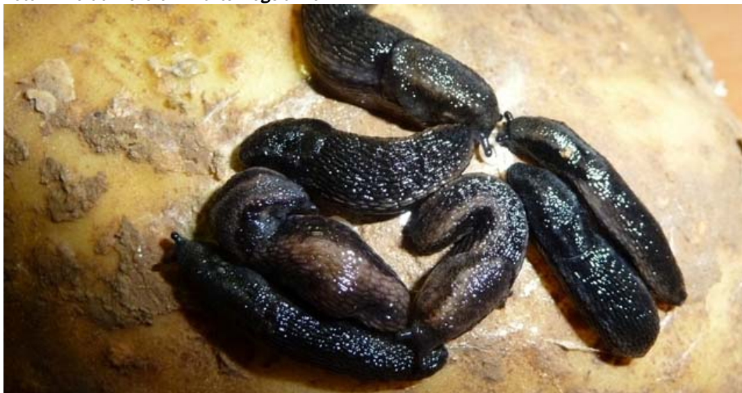
Foto 1. De donkere en zwarte weglakken.

De gele kielnaaktslak ( Tandonia sowerbyi ) wordt met schade aan aardappelknollen in verband gebracht (foto 2). In een partij aardappelen werd één individu aangetroffen.