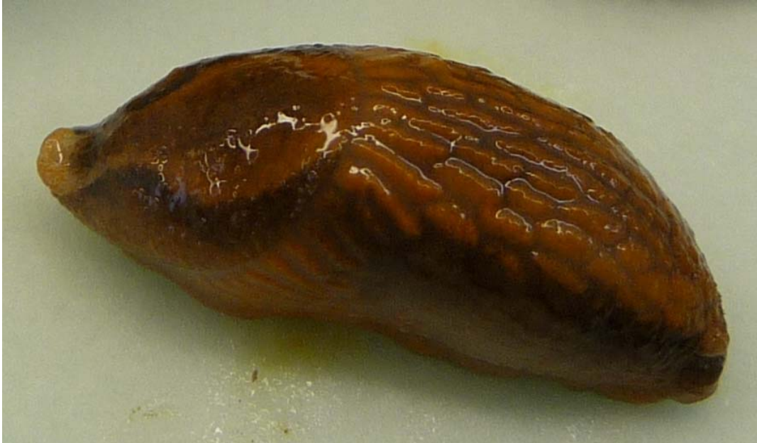
Foto 3. De bruine weglak.

De gevlekte akkerslak ( Deroceras reticulatum ) (foto 4) wordt weinig in verband gebracht met schade aan de knollen, deze soort lijkt moeite te hebben om een intacte aardappel aan te tasten. Wel kan als gevolg van schade aan de knol secundaire schade worden veroorzaakt. Daarnaast worden de stengels en bladeren aangevreten. In één oogst zijn gevlekte akkerslakken aangetroffen in een aardappelhoop met halve, rottende knollen en veel stengels. Deze slakken zijn met de aardappelen en de tarra geoogst en ingeschuurd.