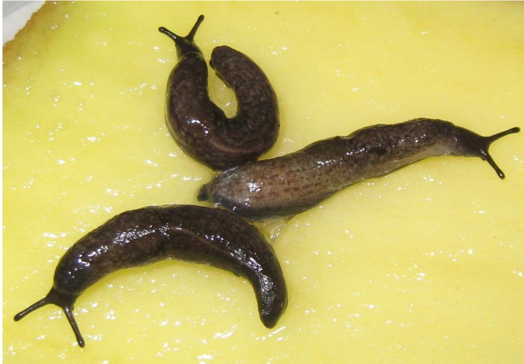
Foto 5. De slanke kielnaaktslak.

De slanke kielnaaktslak ( Tandonia budapestensis ) is een typische bodembewoner en de meest genoemde belager van aardappelknollen (foto 5).