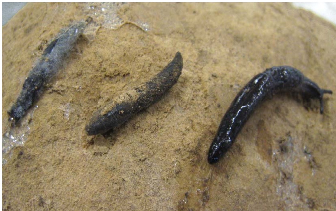
Foto 9. Dode slak in ontbinding (links), net gestorven slak die indroogt (midden) en een nog levende slak (rechts) in een partij aardappelen op 8 december 2009, ca. 8 week na de oogst.

Slakken worden vaak vlak na het inschuren gezien, daarna zijn het de slijmsporen die nog getuigen van slakkenactiviteit (Foto 10). In de bewaring lijkt de schade nauwelijks toe te nemen, tenzij de partij veel tarra bevat. De partij is dan minder goed te ventileren en te drogen waar de slakken van profiteren. De