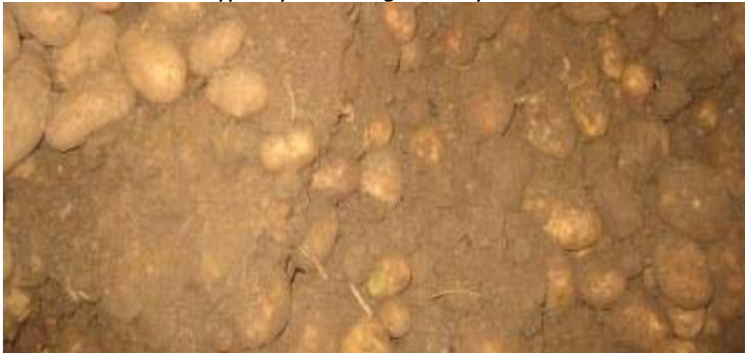
Foto 8. Grondtarra in aardappelhoop met een hogere kans op slakkenschade.

In oktober zijn de meeste aardappelen geoogst. Het type rooier was zeer divers. Het aan- of afwezig zijn van axiaalrollen op de rooimachine had geen duidelijk effect op het voorkomen van schade, de telers zonder problemen gaven echter iets meer het bezit en gebruik van axiaalrollen aan. Onder zowel droge als natte omstandigheden zijn probleem en geen probleem percelen geroid. Alle aardappelen zijn ingeschuurd. Bij twaalf respondenten is weinig tot geen grond geoogst, drie telers met slakkenschade gaven aan dat er meer of veel grond is mee geoogst (foto 8). Bij één teler zonder schade werd wat onbekende schade waargenomen. Van de negen telers met schade gaven vijf aan dat ze de oorzaak van schade niet konden vaststellen.