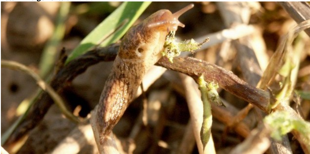
Foto 4. De gevlekte akkerslak.

De gevlekte akkerslak ( Deroceras reticulatum ) (foto 4) wordt weinig in verband gebracht met schade aan de knollen, deze soort lijkt moeite te hebben om een intacte aardappel aan te tasten. Wel kan als gevolg van schade aan de knol secundaire schade worden veroorzaakt. Daarnaast worden de stengels en bladeren aangevreten. In één oogst zijn gevlekte akkerslakken aangetroffen in een aardappelhoop met halve, rottende knollen en veel stengels. Deze slakken zijn met de aardappelen en de tarra geoogst en ingeschuurd.