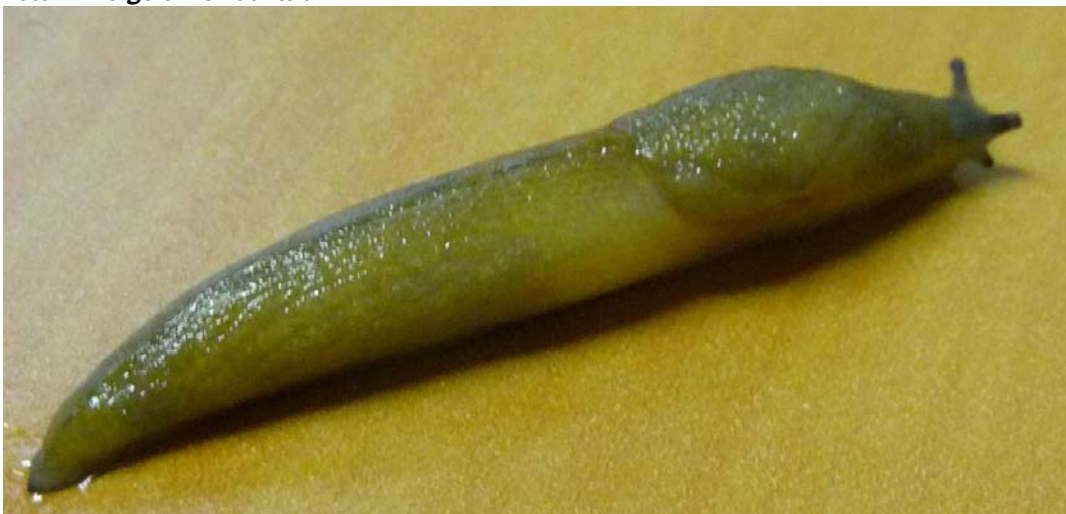
Foto 2. De gele kielnaaktslak.

De gele kielnaaktslak ( Tandonia sowerbyi ) wordt met schade aan aardappelknollen in verband gebracht (foto 2). In een partij aardappelen werd één individu aangetroffen.