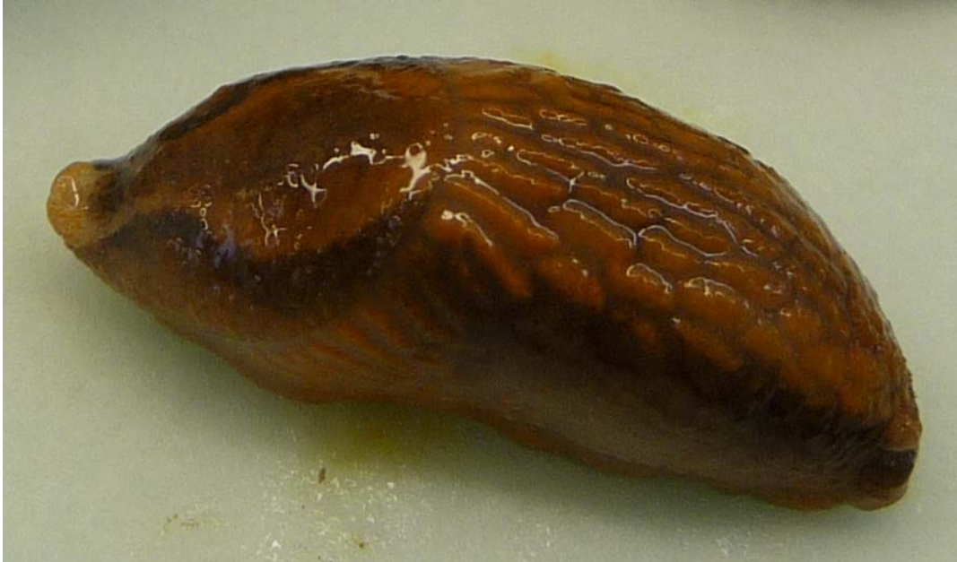
Foto 3. De bruine weglak.

De gevlekte akkerslak ( Deroceras reticulatum ) (foto 4) wordt weinig in verband gebracht met schade aan de knollen, deze soort lijkt moeite te hebben om een intacte aardappel aan te tasten. Wel kan als gevolg van schade aan de knol secundaire schade worden veroorzaakt. Daarnaast worden de stengels en bladeren aangevreten. In één oogst zijn gevlekte akkerslakken aangetroffen in een aardappelhoop met halve, rottende knollen en veel stengels. Deze slakken zijn met de aardappelen en de tarra geoogst en ingeschuurd.