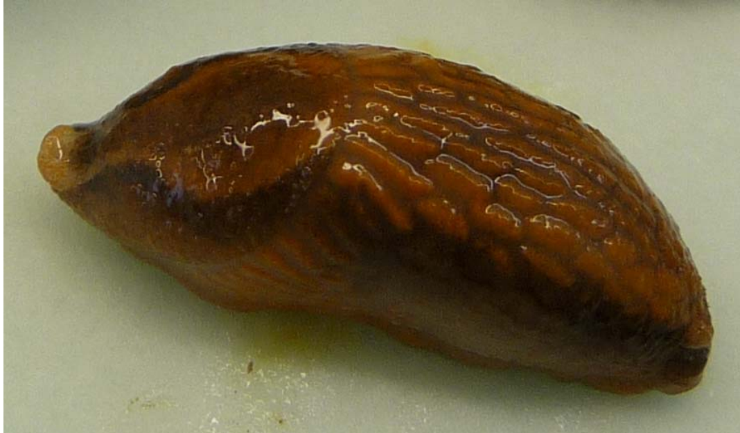
Foto 3. De bruine weglak.

De gevlekte akkerslak ( Deroceras reticulatum ) (foto 4) wordt weinig in verband gebracht met schade aan de knollen, deze soort lijkt moeite te hebben om een intacte aardappel aan te tasten. Wel kan als gevolg van schade aan de knol secundaire schade worden veroorzaakt. Daarnaast worden de stengels en bladeren aangevreten. In één oogst zijn gevlekte akkerslakken aangetroffen in een aardappelhoop met halve, rottende knollen en veel stengels. Deze slakken zijn met de aardappelen en de tarra geoogst en ingeschuurd.