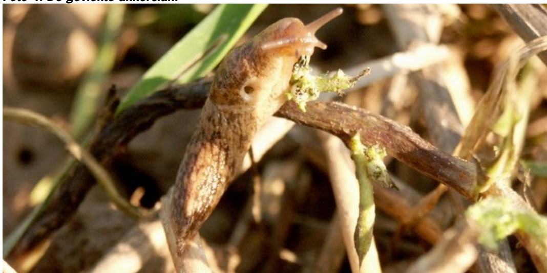
Foto 4. De gevlekte akkerslak.

De gevlekte akkerslak ( Deroceras reticulatum ) (foto 4) wordt weinig in verband gebracht met schade aan de knollen, deze soort lijkt moeite te hebben om een intacte aardappel aan te tasten. Wel kan als gevolg van schade aan de knol secundaire schade worden veroorzaakt. Daarnaast worden de stengels en bladeren aangevreten. In één oogst zijn gevlekte akkerslakken aangetroffen in een aardappelhoop met halve, rottende knollen en veel stengels. Deze slakken zijn met de aardappelen en de tarra geoogst en ingeschuurd.