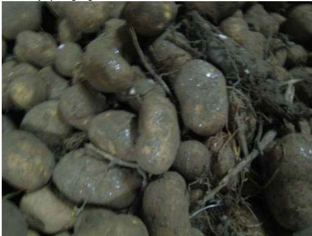
Foto 10. Slijmsporen getuigen van slakkenactiviteit.

Respondenten zijn gesplitst in bedrijven met en zonder problemen. Telers met problemen hadden schade waarbij meer dan 2% van de aardappelen waren aangetast. Nul tot maximaal 40 % schade wordt gemeld. Toenemende schade verhoogt de kosten van uitsorteren, te veel schade maakt een partij onverkoopbaar. Uit het onderzoek blijkt dat de problemen met slakken in aardappelen niet op alle bedrijven hebben plaatsgevonden. Op bedrijven met problemen komt schade ook niet op alle percelen voor. Slakkenvraat in aardappelen wordt voornamelijk de laatste drie jaar in Zuid-Limburg gemeld met 2008 als hoogtepunt. In hoeverre de problemen toenemen is niet vast te stellen. Of het probleem bedrijf- of perceelsgebonden is moet nog blijken de komende jaren. Immers, om de zoveel jaar komen de aardappelen terug op hetzelfde perceel, terwijl dit fenomeen niet in andere gewassen wordt signaleerd.