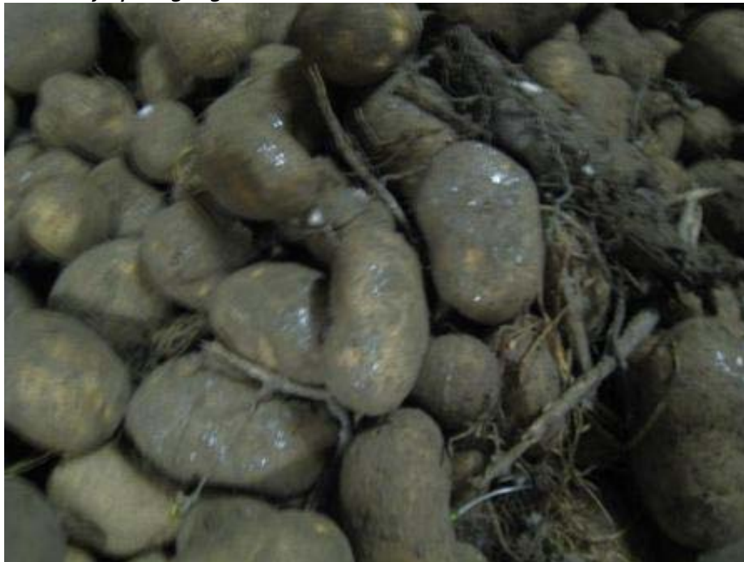
Foto 10. Slijmsporen getuigen van slakkenactiviteit.

Respondenten zijn gesplitst in bedrijven met en zonder problemen. Telers met problemen hadden schade waarbij meer dan 2% van de aardappelen waren aangetast. Nul tot maximaal 40 % schade wordt gemeld. Toenemende schade verhoogt de kosten van uitsorteren, te veel schade maakt een partij onverkoopbaar. Uit het onderzoek blijkt dat de problemen met slakken in aardappelen niet op alle bedrijven hebben plaatsgevonden. Op bedrijven met problemen komt schade ook niet op alle percelen voor. Slakkenvraat in aardappelen wordt voornamelijk de laatste drie jaar in Zuid-Limburg gemeld met 2008 als hoogtepunt. In hoeverre de problemen toenemen is niet vast te stellen. Of het probleem bedrijf- of perceelsgebonden is moet nog blijken de komende jaren. Immers, om de zoveel jaar komen de aardappelen terug op hetzelfde perceel, terwijl dit fenomeen niet in andere gewassen wordt signaleerd.