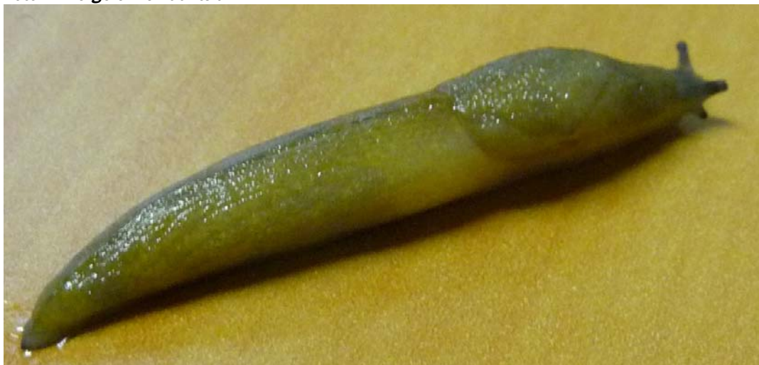
Foto 2. De gele kielnaaktslak.

De gele kielnaaktslak ( Tandonia sowerbyi ) wordt met schade aan aardappelknollen in verband gebracht (foto 2). In een partij aardappelen werd één individu aangetroffen.