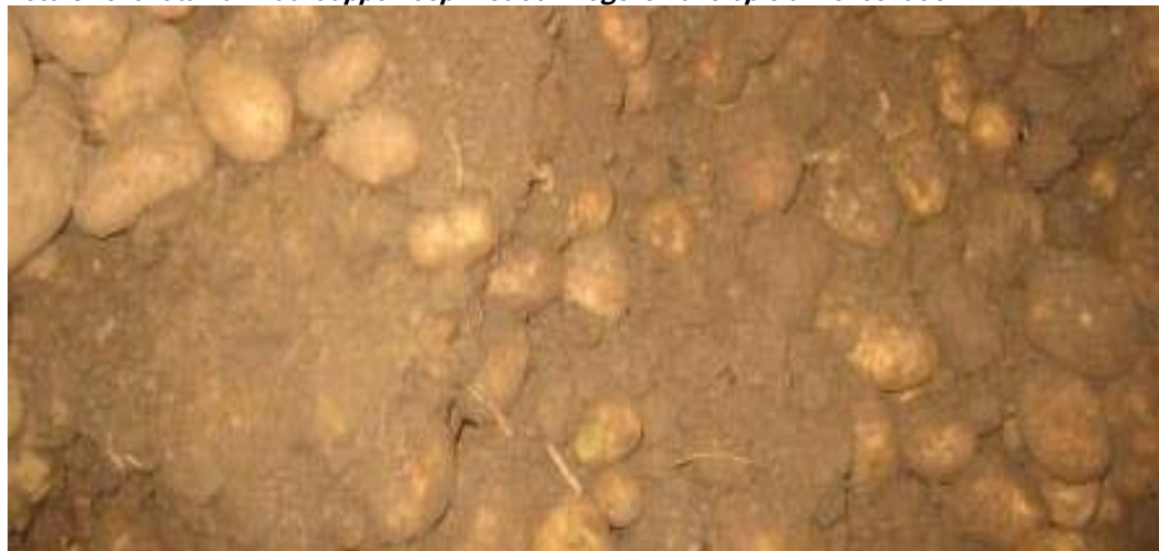
Foto 8. Grondtarra in aardappelhoop met een hogere kans op slakkenschade.

In oktober zijn de meeste aardappelen geoogst. Het type rooier was zeer divers. Het aan- of afwezig zijn van axiaalrollen op de rooimachine had geen duidelijk effect op het voorkomen van schade, de telers zonder problemen gaven echter iets meer het bezit en gebruik van axiaalrollen aan. Onder zowel droge als natte omstandigheden zijn probleem en geen probleem percelen geroid. Alle aardappelen zijn ingeschuurd. Bij twaalf respondenten is weinig tot geen grond geoogst, drie telers met slakkenschade gaven aan dat er meer of veel grond is mee geoogst (foto 8). Bij één teler zonder schade werd wat onbekende schade waargenomen. Van de negen telers met schade gaven vijf aan dat ze de oorzaak van schade niet konden vaststellen.