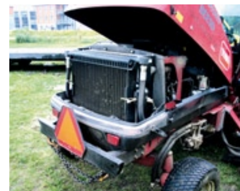
Het SmartCool-systeem schakelt automatisch in als het koelsysteem te heet dreigt te worden.