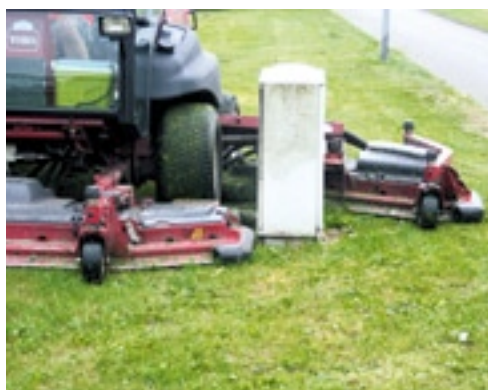
Met de machine kun je strak langs obstakels maaien. Wordt het te krap, dan klap je gewoon één of meerdere zijdekken op.