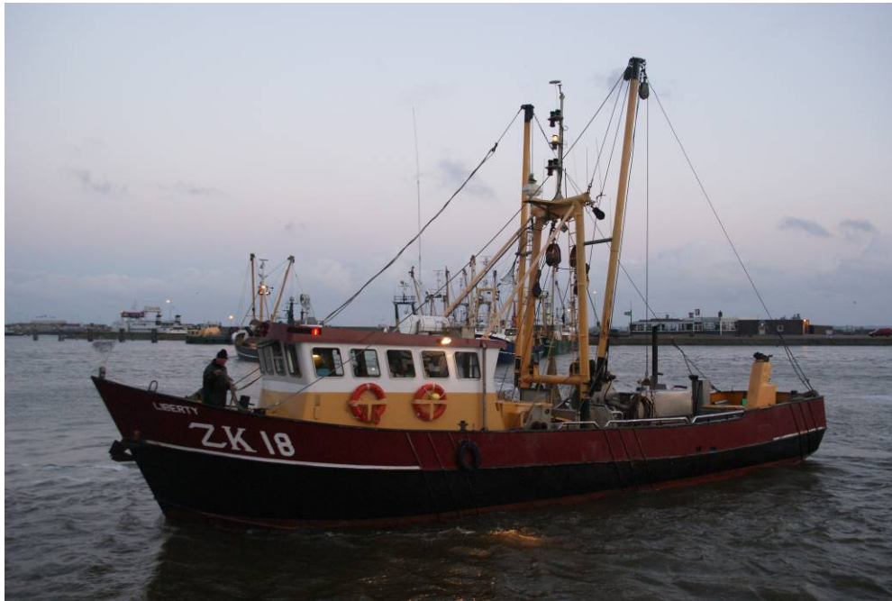
Een van de bemonsterde schepen, de ZK18