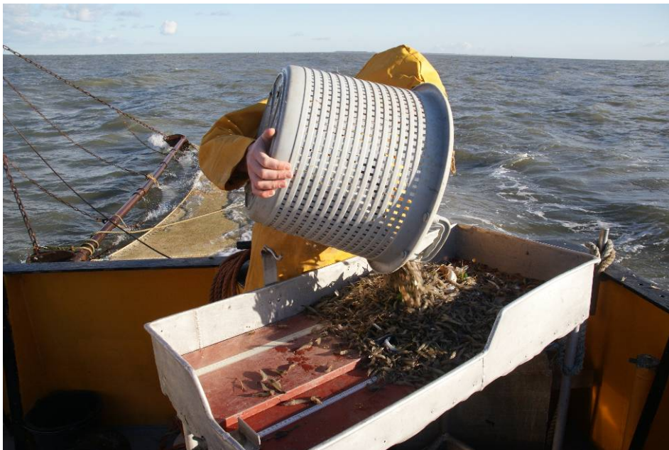
Vangst voor sorteerproces aan boord van de ZK18 op 24 november 2008