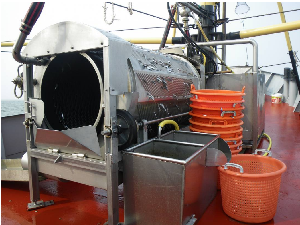
Spoelsorteermachine aan boord van de WON77

In het kader van beleidsondersteunend onderzoek binnen het cluster Ecologische Hoofdstructuur (Thema Mariene EHS (BO-02-008)) is in 2008 gestart met een onderzoek naar de garnalenvisserij in de Waddenzee, dat doorloopt tot in 2009. Naast een overzicht van de huidige garnalenvisserij met behulp van VIRIS en VMS gegevens, is een begin gemaakt met onderzoek naar van bijvangsten. In deze rapportage wordt de voortgang van dit project beschreven. In 2009 zal de uiteindelijke rapportage opgeleverd worden. Vanwege het beperkte aantal waarnemersreizen zal hier nog geen analyse van de gegevens gepresenteerd worden. Binnen dit project is nadrukkelijk geen onderzoek gedaan naar de effecten van de garnalenvisserij op de bodem.