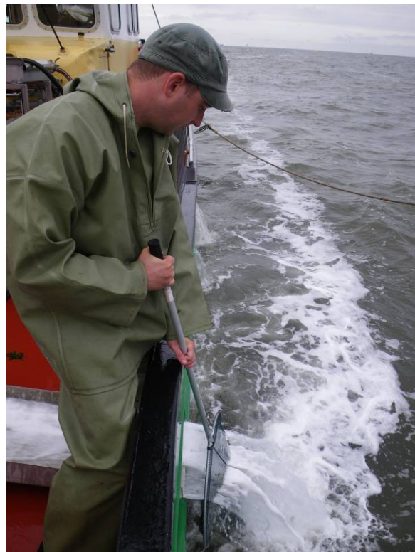
Het opvangen van de discards met een schepnet