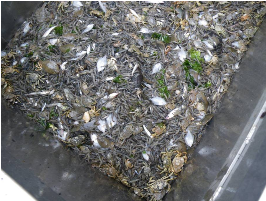
Vangst voor sorteerproces aan boord van de WON77 op 29 juli 2008