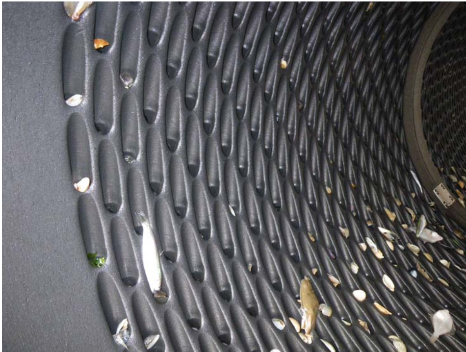
Spoeltrommel aan boord van de WON77