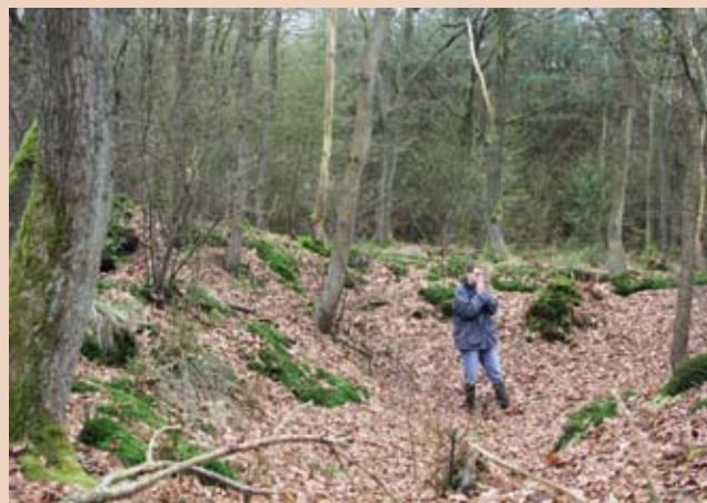
Uiterst links: Beukenlaan Links: Wal Rechts: Onderduikershol Rechter pagina: Eikvaren op een walstructuur

oud. Het is niet uitgesloten dat deze lanen ‘opvolgers’ zijn van eerdere lanen die er al in de 18e en 19e eeuw lagen. Enkele lanen, bijvoorbeeld de lanen rond de grafkelder op De Oude Bork, zijn zelfs ouder (circa 150 jaar).