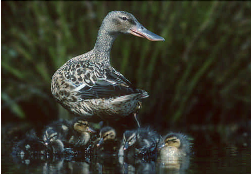
Foto 4: Slobeend vrouwtje met kuikens zoekt het water op