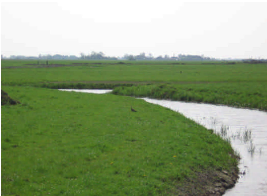
Foto 7: Een hoog waterpeil biedt geschikte foerageeromstandigheden voor Kievitkuikens

Doel: verbeteren van de foerageeromstandigheden, met name in mei en juni, wanneer de grasgroei en verdamping toeneemt en het uitdrogen van de toplaag een knelpunt kan worden.