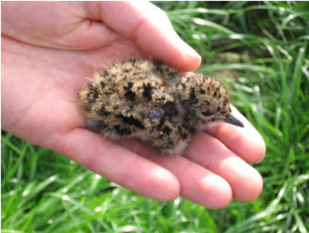
Foto 10: We moeten weidevogelkuikens een handje helpen......

In een pilotstudie in Friesland met 3 meter brede onbemeste graslandranden aan weerszijden van sloten werden de randen sterk geprefereerd door Grutto- en Tureluurkuikens. Het is niet bekend of dit ook voor andere configuraties en in andere regio's geldt. Het is evenmin bekend of onbemeste randen op deze wijze ook leiden tot voldoende kuikenoverleving en welke ruimtelijke setting (o.a. combinatie met ander kuikenland) het meest effectief is.