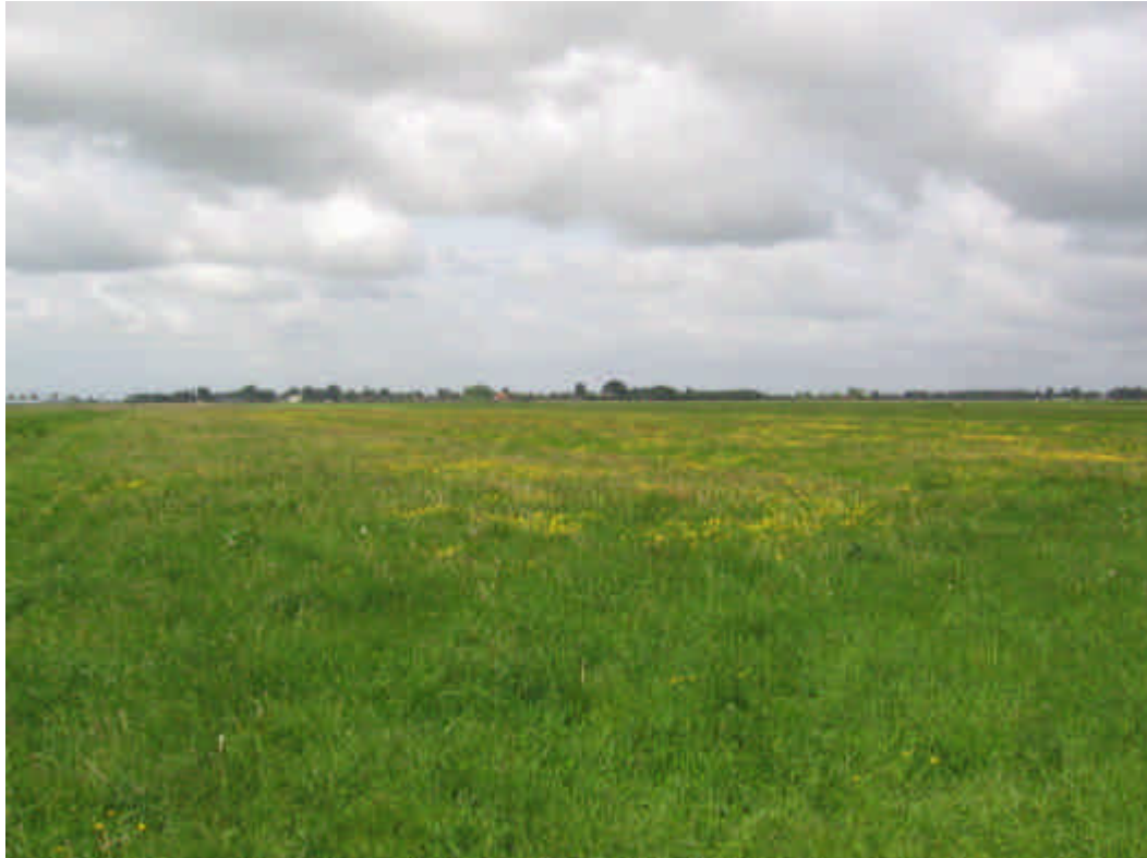
Foto 9: Vermindering van de bemesting leidt tot meer kruiden