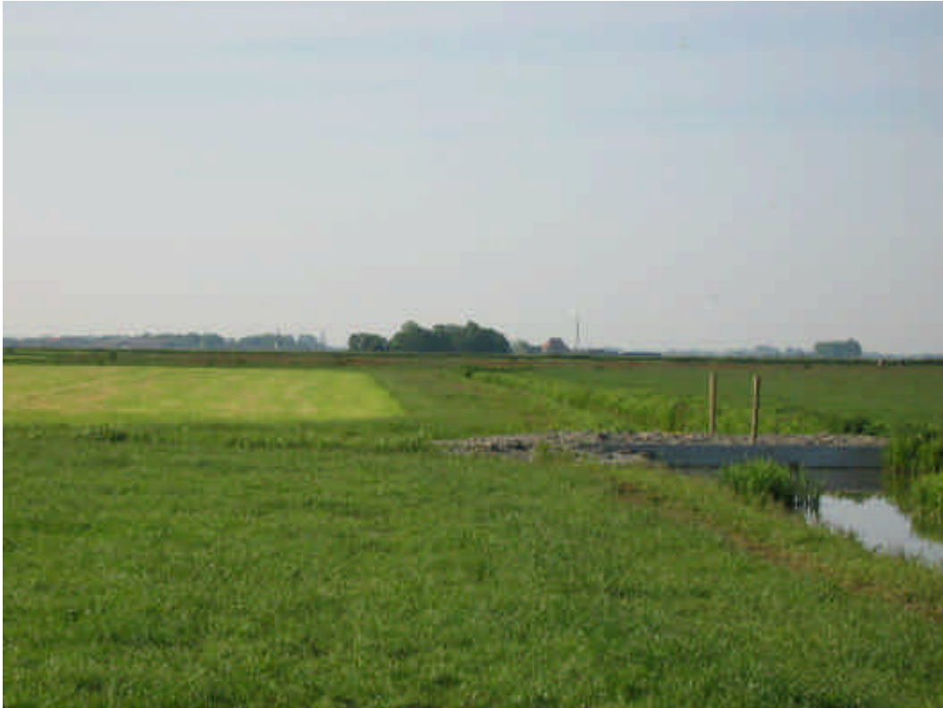
Foto 3: In juni prefereren Scholeksterkuikens gemaaid land