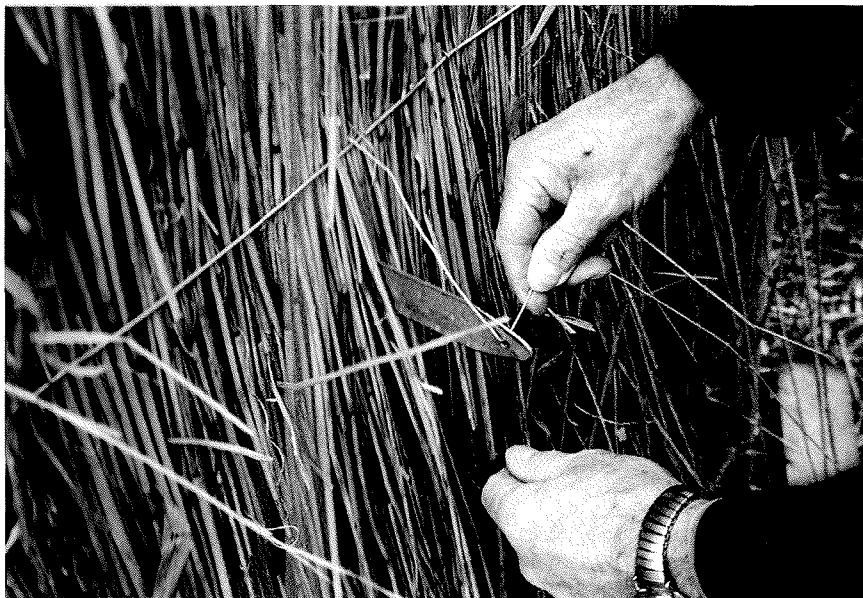
Landschapsbeheer Friesland ondersteunt vrijwilligers die eendenkooien onderhouden. Het onderhoud van een eendenkooi is een arbeidsintensieve klus. Zo is het voortbestaan van deze cultuurhistorisch waardevolle landschapselementen voorlopig verzekerd.

altijd een beroep doen op Landschapsbeheer Nederland. Ze kunnen aankloppen voor gereedschap of voor begeleiding in het veld. Maar Landschapsbeheer Nederland doet meer. Ze heeft veel contacten met verschillende