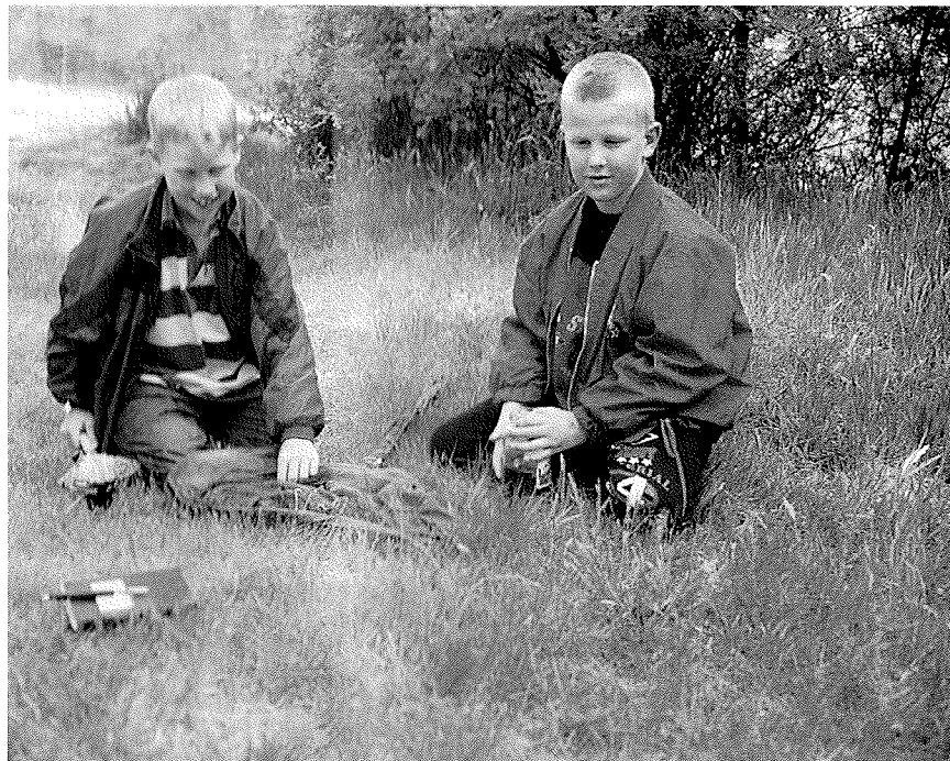
Kinderen tussen 9 en 12 jaar leren vooral door ontdekken, zelf op onderzoek uit te gaan, kennis te verzamelen door te vragen, te lezen en niet te vergeten door computergebruik. Het zijn soms echte wetenschappertjes, die fanatiek aan natuurstudie kunnen doen.

Er zijn voldoende eenvoudige hulpmiddelen en programma's ontwikkeld. Informeer zonnig bij IVN, Stichting Veldwerk Nederland of de Vlinderstichting. Bedenk echter wel, dat begeleiding van een volwassene vrijwel