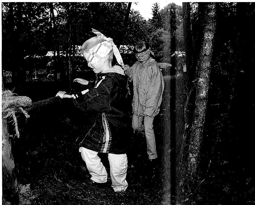
Om het kinderpúblik een echte natuurervaring te geven, zal een beheerder de kinderen in contact moeten brengen met de natuur die kenmerkend is voor dat gebied. Hiervoor zijn allerlei werkvormen ontwikkeld, variërend van speurtochten tot natuurtheater, van sluip-door-kruip-door routes tot audiotours.