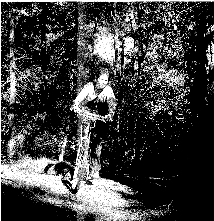
Wijkorganisaties kunnen intensief betrokken zijn bij het groenbeheer maar ook individuele bezoekers (wandelaars, fietsers, joggers e.a.) kunnen soms meepraten over het beheer.

Ook wijkorganisaties worden intensief betrokken bij het groenbeheer. Zij zijn belangrijke ambassadeurs richting omwonenden. Wij proberen ook individuele bezoekers (wandelaars, fietsers, joggers e.a.) zoveel mogelijk bij het