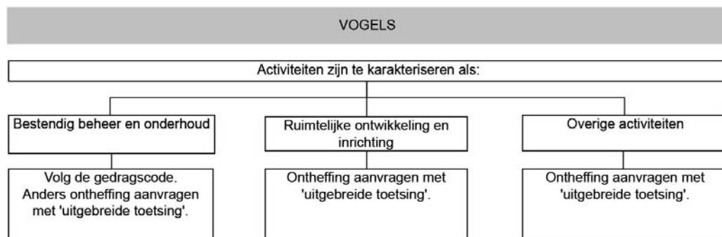
Schema 1.3 Overzicht beschermingsregime vogels

Voor werkzaamheden in het kader van ruimtelijke ontwikkeling en inrichting moet bij overtreding van de verbodsbepalingen voor vogels altijd een ontheffing worden aangevraagd. Deze ontheffingsaanvraag wordt onderworpen aan een uitgebreide toets.