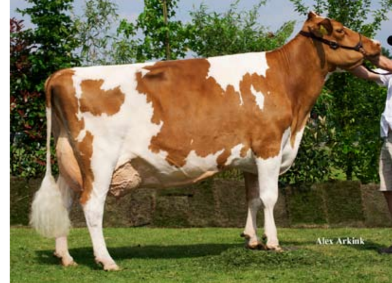
Zeedieker Mon-Chri 1 (v. Jordan), reservekampioene oud Productie: 4.04 305 11.205 4,35 3,23