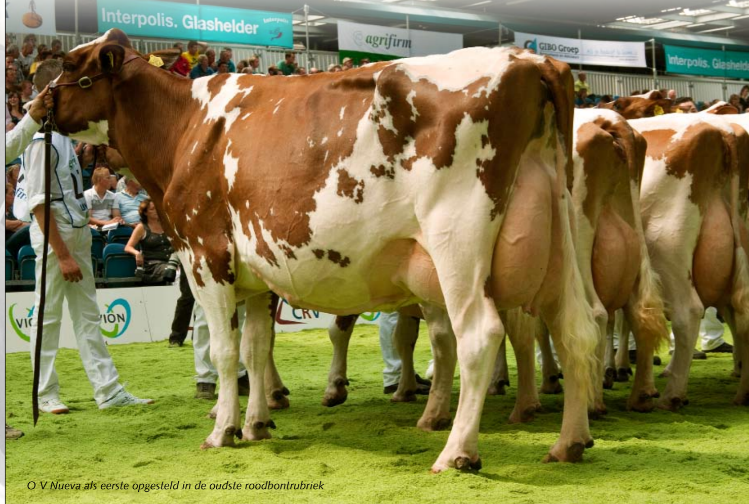
O V Nueva als eerste opgesteld in de oudste roodbontribriek