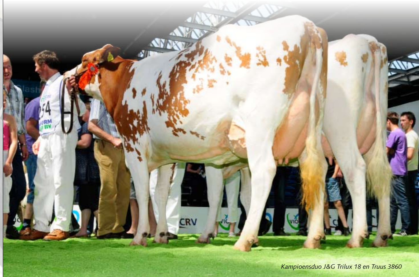
Kampioensduo J&G Trilux 18 en Truus 3860