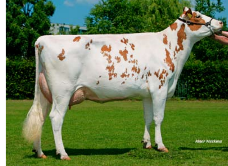
Truus 3860 (v. Classic), reservekampioene midden Productie: 2.01 305 6011 4,65 3,94

Het was snel duidelijk dat de finale zou uitmonden in een Classiconderonsje tussen de fraaie Truus 3860 en krachtpatser pur sang Trilux 18. Het Classicfeestje was compleet toen bleek dat ook de strijd om de derde plek ging tussen twee Classicstelgen. Van de fel duellerende halfzuses Rika 58 en Jacoba 47 eiste