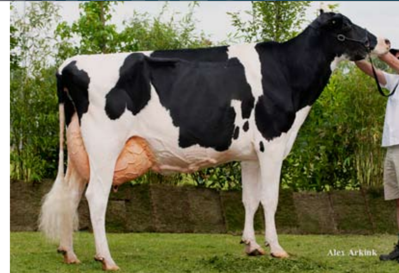
Bons-Holsteins Koba 167 (v. Stormatic), reservekampioene oud Productie: 4.09 305 13.870 4,12 3,44