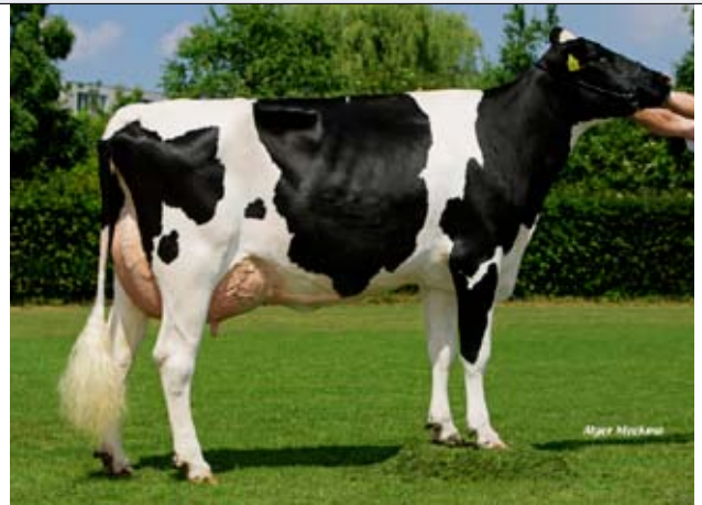
Beppe 257 (v. Apina Fortune), 1a in rubriek 5 Productie: 2.02 305 7709 3,77 3,55