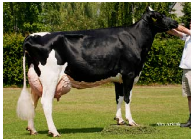
Buiteneind Anney 2 (v. Lucky Mike), 1a in rubriek 6 Productie: 3.00 305 11.661 3,18 3,26