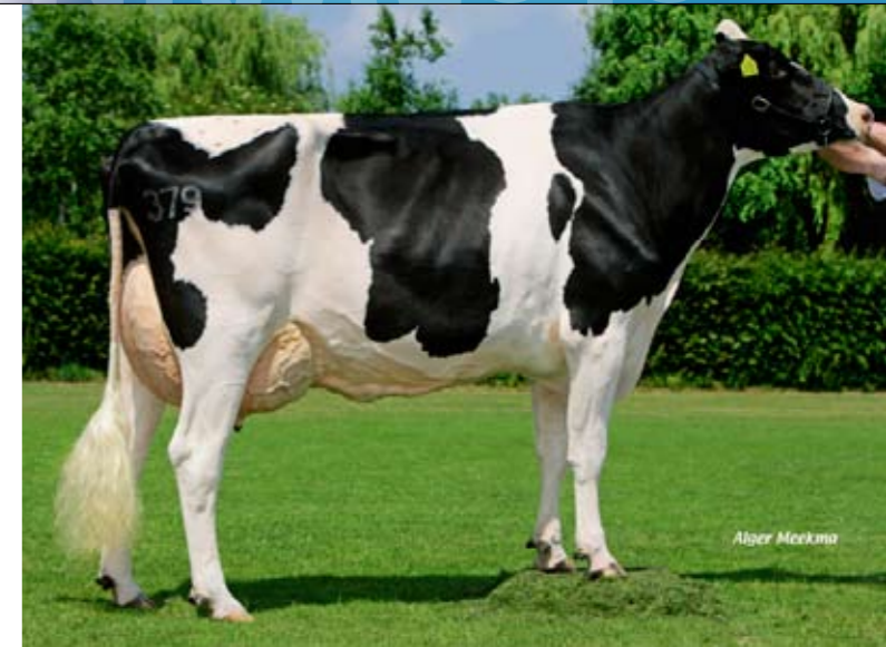
Lena 67 (v. Tribute), reservekampioene midden Productie: 3.01 305 11.279 3,37 3,24