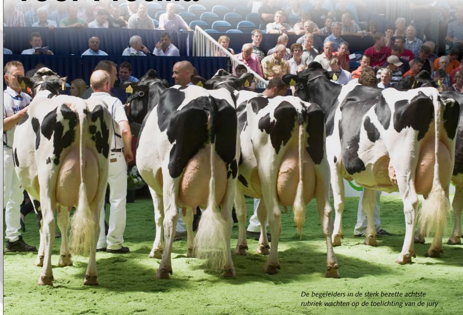
De begeleiders in de sterk bezette achtste rubriek wachten op de toelichting van de jury