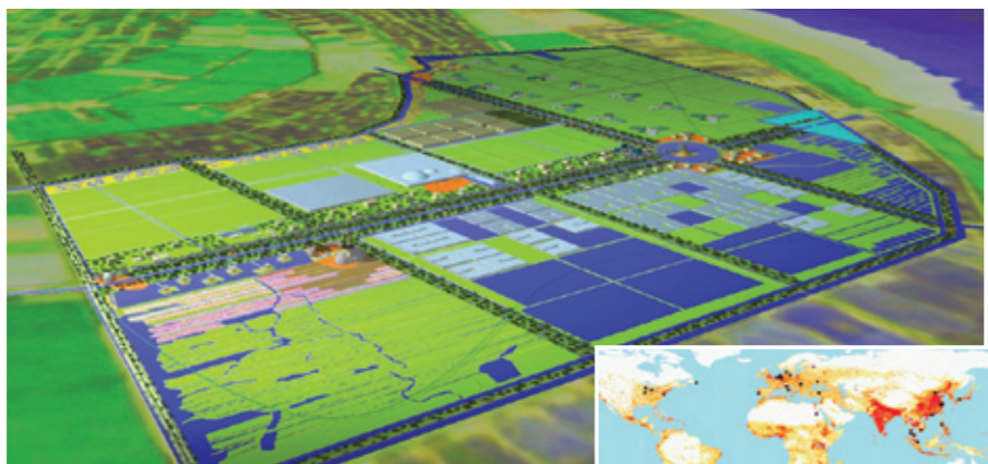
Agroparken over de hele wereld.

Het opzetten van een internationaal netwerk rond agroparken is geen simpele klus.