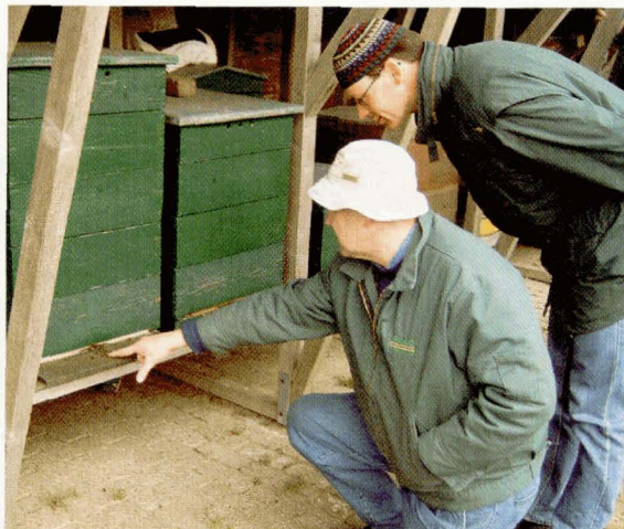
Interesse wekken bij alle leeftijden.

Ik ben ervan overtuigd dat het werkt, de deelnemers zijn enthousiast.