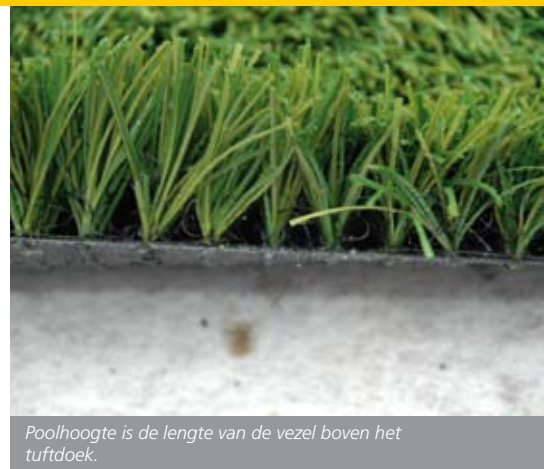
Poolhoogte is de lengte van de vezel boven het tuftdoek.

Definitie: Norm van KNVB voor kunstgras en natuurgras voetbalvelden. Geaccordeerd door de normcommissie.