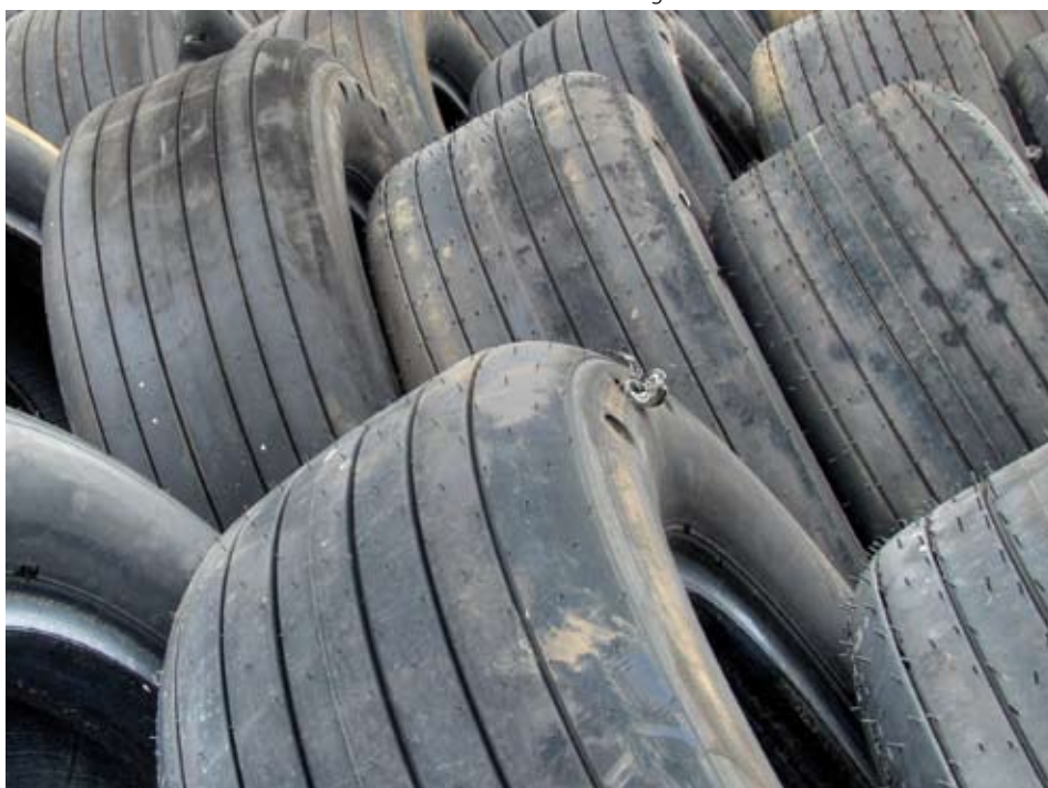
SBR-granulaat is gemaakt uit de rubber van oude autobanden.

Definitie: Vorm van instrooigranulaat. Kan variëren van sliertjes tot bolletjes.