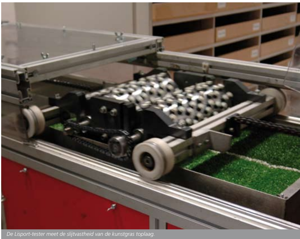
De Lisport-tester meet de slijtvastheid van de kunstgras toplaag.

Definitie: Lijst van door de sportbonden erkende sportvloersystemen. Vloeren op deze lijst voldoen aan de normen van NOC*NSF, zowel op het gebied van sportfunctionele eigenschappen alsook op het gebied van veiligheid en duurzaamheid.