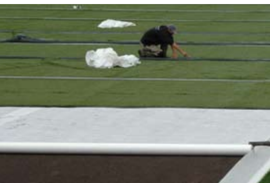
Geotextiel ofwel drukverdelend doek zorgt voor een beschermende laag tussen onderbouw en kunstgras.

Opmerking Edel Grass: De beste in zijn soort op dit moment.