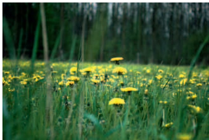
Voorjaar in de Flevopolder

Uiteraard is de activiteit van het bijenvolk afhankelijk van het weer en vooral de temperatuur. De imkers uit de zuidelijke provincies hebben waarschijnlijk in maart al een aantal raten laten