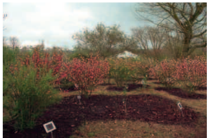
Uit de oude doos: voorjaar in de drachtplantentuin van de Ambrosiushoeve

veel gevallen organiseren de plaatselijke afdelingen het reizen naar het fruit. Een actief lid heeft dan in het vroege voorjaar bij fruittelers al geïnformeerd hoeveel volken er geplaatst kunnen worden. Deze imker krijgt dan ook van de fruitteler te horen waar en wanneer de volken in de boomgaard geplaatst kunnen worden. Voor de beginnend imker is het om verschillende redenen handig om met de vereniging mee te reizen. Op de eerste plaats hoeft deze niet zelf contact te zoeken en afspraken te maken over de vergoeding met de fruitteler. Op de tweede plaats kan je als beginnend imker de kunst van het reizen afkijken van de ervaren imker. Reizen met bijen is een prachtige activiteit maar het is meer dan de kast dichtdoen en reizen maar. Zo is het belangrijk om met gezonde moergoede volken te reizen die minstens 8-10 ramen bezetten en 5-6 ramen broed hebben. Let er ook op dat de kasten goed sluiten want, gegarandeerd, de bijen zoeken door de kleinste gaatjes de weg naar buiten, als ze door het verplaatsen van de kasten worden gestoord.