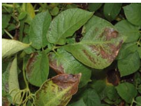
Boriumgebrek, hier in een aardappelplant, kent een nauw traject tussen overmaat en tekort.

Een typisch gebrekverschijnsel van ijzer is Fe-chlorose. Door een verstoorde bladgroenopbouw vertoont het blad lichtgeel tot witte delen tussen de bladnerven. Aangezien ijzer weinig mobiel is in de plant, zijn het vooral de jonge bladeren die het eerste deze lichtverkleuring vertonen. Een overmaatverschijnsel van ijzer in de plant is onbekend. Wel kan de aanwezigheid van veel ijzer in