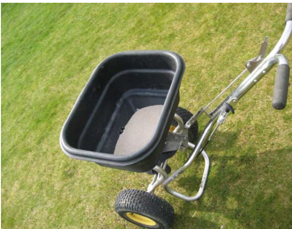
Veel gekorrelde mengmeststoffen bevatten reeds sporelementen.

Streefwaarden voor sporelementen in grassen De streefwaarden voor sporelementen kan sterk verschillen per grassoort zoals blijkt uit tabel 1. Zo blijkt dat roodzwenk meer ijzer en koper nodig heeft en struisgrassen juist meer mangaan. Aangezien de vatbaarheid voor diverse ziekten onder andere afhangt van het mangaangehalte in de grasplant en struisgrassen voor diverse ziekten gevoeliger zijn dan roodzwenk verklaart dit deels ook de grotere behoefte aan mangaan bij struisgras. Aangeraden wordt om tijdens periode van hoge groeisnelheid in het gras (mei/juni) en voor de herfst (begin september) een grasmonster te laten analyseren op onder andere het gehalte aan sporelementen. Engels raaigras heeft vaak meer ijzer nodig ten opzichte van veldbeemd. Dit verklaart tevens het grotere optische effect van ijzerbemesting op sportvelden met een hoger aandeel Engels raai en een geringer aandeel veldbeemd.