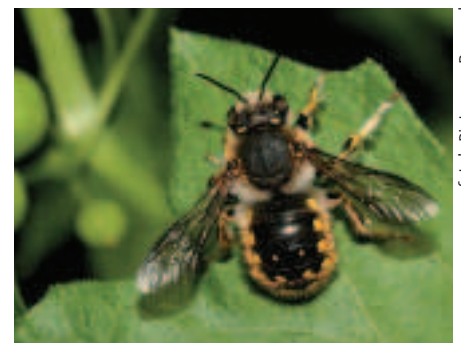
Mannetje grote wolbij.