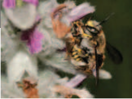
Paring grote wolbijen op wollige andoorn.