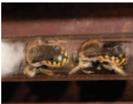
Nestgang door grote wolbij met plantenharen gevuld.

Grote wolbijen geven de voorkeur aan roze lipbloemen. De wollige andoorn is dubbel favoriet bij de vrouwtjes, omdat die ook nestmateriaal levert. Bij deze plant zijn ook de mannen heel vaak te vinden om ijverige vrouwen te overvallen. Het knagen van haren gebeurt gewoonlijk aan de onderkant van de bladeren, of aan de stengels. Bij prikneus aan de onderkant van de bloemhoofdjes. Verder zijn alle