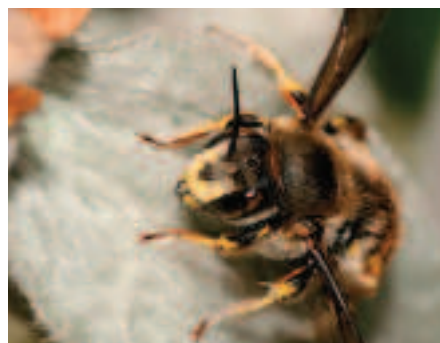
Mannetje grote wolbij frontaal.