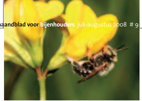
Mannetje kleine wolbij.

andoornsoorten favoriete drachtplanten. Betonie is daarbij als tuinplant bijzonder aan te bevelen. Hartgespan hoort ook tot de zeer graag bezochte planten, evenals gamandersoorten. Maar de grote wolbijen tref je ook wel aan op vingerhoedskruid en op vlinderbloemige planten. Zoals bij alle wolbijsoorten het geval is, verzamelen vrouwtjes van de grote wolbij het bijna witte stuifmeel aan buikharen. Om energie bij te tanken zie je ze ook op sedumsoorten als huislook drinken. Wolbijen kennen maar één generatie per jaar.