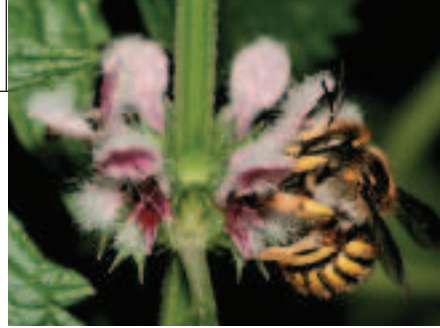
Vrouwetje grote wolbij op hartgespan.