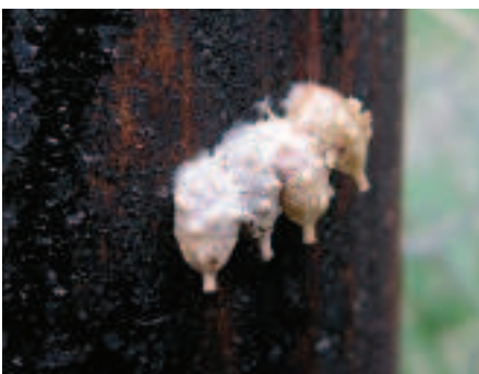
Vier cellen van de kleine harsbij aan een gecreosote paal.

Het is een belevenis om wolbijen bezig te zien in hun activiteiten. Omdat ze vaste gewoontes hebben, zijn ze goed te observeren bij hun favoriete planten. Natuurlijk dienen die dan wel voorhanden te zijn. In een tuin is het heel goed mogelijk om voldoende variatie aan drachtplanten voor wolbijen tot bloei te laten komen. Wolbijen die haren knagen laten zich goed naderen, mits niet te snel en er niet tegen de betreffende plant gestoten wordt. Het gedrag van de mannetjes is tussen de bloemen ook goed te observeren. Het is wel aan te bevelen om stil te staan. Vaak komen mannetjes, stilstaand in de lucht, even poolshoogte nemen van het nieuwe object in hun omgeving, maar gewoonlijk trekken ze zich er al snel niets van aan. Omdat grote wolbijen zo'n opvallende verschijningen zijn, zijn het ook heel geschikte bijen om nieuwsgierigen in uw tuin kennis te laten nemen van de wonderlijke wereld van de solitaire bijen.