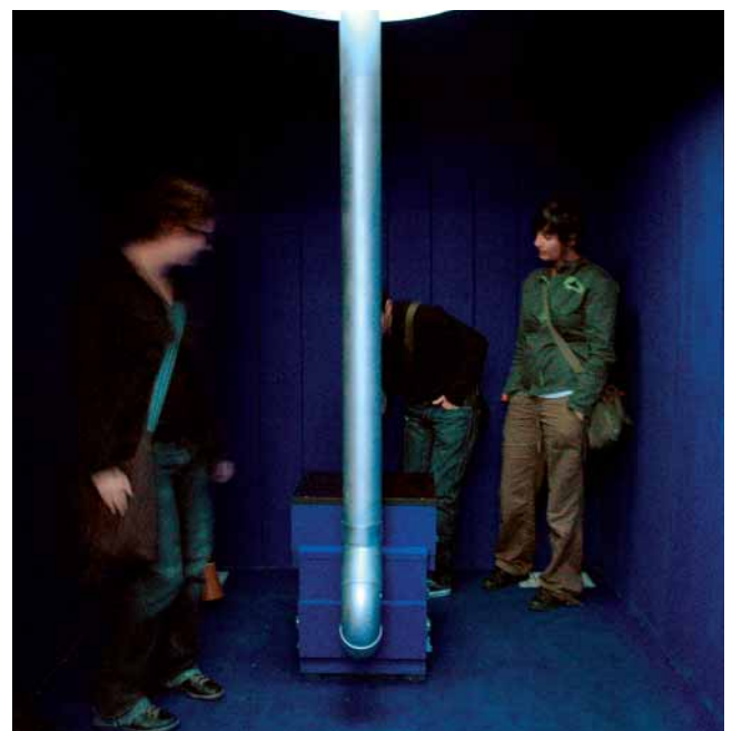
...met een kleine schoorsteen als vlieguitlaat.