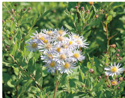
Afb. 2 Aster ageratoides 'Ashvi'; een witte variant van de herfstaster.