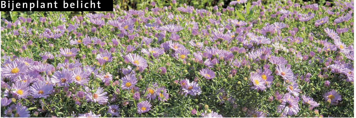
Aster ageratoides 'Asran'. Een haag van deze gecultiveerde herfstaster geeft een prachtige lilablauwe kleur aan de tuin in september/oktober. Evenals de inheemse Zeeaster rijk aan pollen en nectar. Op zonnige dagen vind je er veel bijen op, maar ook andere insectensoorten, die in een warme herfst nog volop actief zijn.