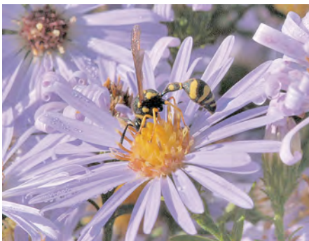
Afb. 7 Urntjeswesp; genoemd naar het vaasachtige kruijkje van modder en klei waarin zij rupsen depo-neert en haar eitje legt.

Wie op een zonnige herfstdag een haag herfstasters observeert, zal verbaasd zijn over de keur van bestuivers die zich aandienen; behalve bijen en vlinders valt het aantal wespensoorten op (afb. 4-9).