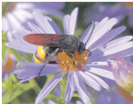
Afb. 8 De Dolkwesp komt uit Z.-Europa; zij legt haar eitjes ondergronds op de larve van de Neushoornkever en voedt zichzelf met nectar.