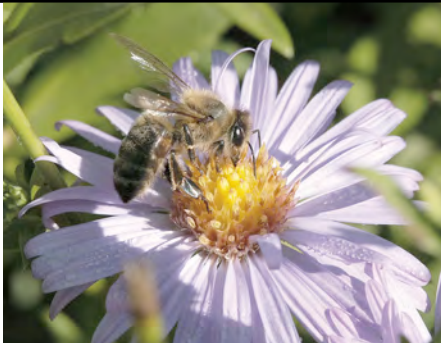
Afb. 4 De herfstaster trekt veel bijen aan met haar ruime aanbod van nectar en pollen.