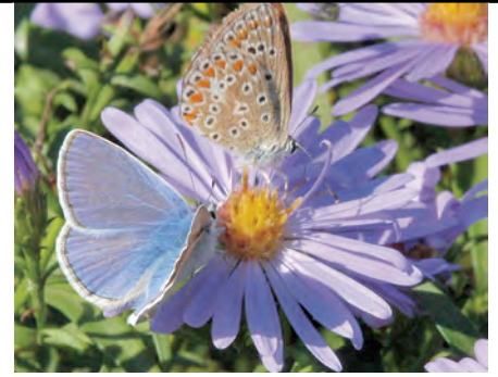
Afb. 6 Icarusblauwtjes: links het mannetje (hemels blauw); rechts het vrouwtje.

men' en is geel. Na de bloei ontstaan langwerpige bruine zaden die, hangend aan een draadparapluitje, de oorspronkelijke pappus (afb.3 p), door water of wind worden verspreid. Na de ontkieming wordt in het eerste jaar een rozet gevormd; in het tweede jaar groeit de steel en gaat deze bloeien. Ook op winterknoppen komen planten omhoog, die dan één- of meerjarig zijn. Het langwerpige blad is dik en vlezig; het bevat veel vocht om het zoutgehalte van de plant te regelen. Het wordt als groente gegeten.