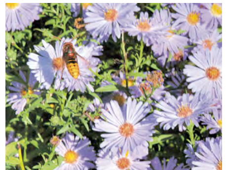
Afb. 9 Deze Hoornaar is op zoek naar vliegen, wespen, bijen of rupsen, die op de Aster rijkelijk voorhanden zijn.