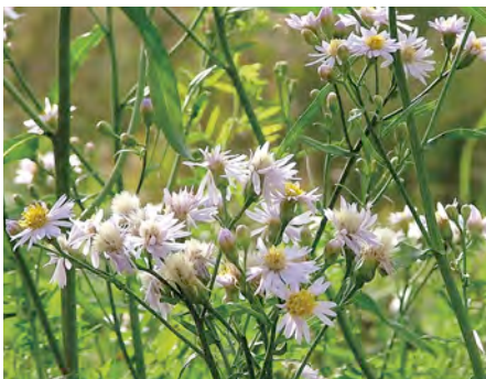
Afb. 1 Zeeaster of Zulte. Onze enige inheemse aster is een zomerbloeier.

Op korte dikke wortelstokken komen krachtige onbehaarde en kale stelen omhoog, die reeds van onder af zijscheuten maken, wanneer de plant ruimte heeft; of die, waar ruimte ontbreekt, alleen van boven vertakken tot een brede struikachtige plant. Afhankelijk van de omgeving wordt de plant 10-90 cm hoog. De talrijke hoofdjes vormen een schermvormige pluim. De stralende randbloemen ('straalbloemen') zijn wit, lila of blauw; soms ontbreken zij. Het hart bestaat uit 'buisbloe-